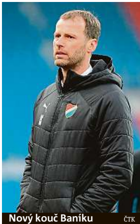
Nový kouč Baníku