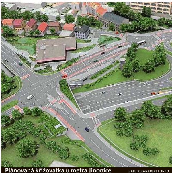
Plánovaná křižovatka u metra Jinočice

Kromě stavebního úřadu je pak podle něj problém ve skupince odpůrců stavby z řad místních obyvatel, která drží v šachu všechny dotčené instituce. „Z výzkumu společnosti Sanep z podzimu roku 2017 přitom vyplynulo, že většina obyvatel, kterých se výstavba Radlické radiály dotkne, je nespokojená s aktuální dopravní situací a výstavbu Radlické radiály považuje