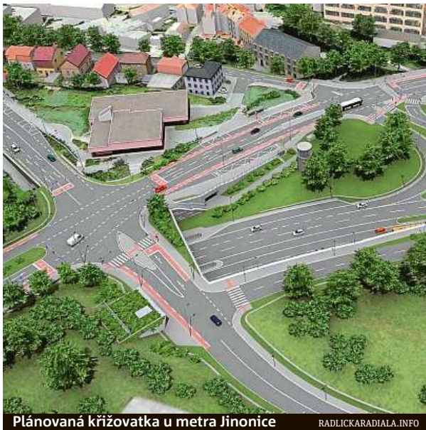
Plánovaná křižovatka u metra Jinoňovice

Kromě stavebního úřadu je pak podle něj problém ve skupince odpůrců stavby z řad místních obyvatel, která drží v šachu všechny dotčené instituce. „Z výzkumu společnosti Sanep z podzimu roku 2017 přitom vyplynulo, že většina obyvatel, kterých se výstavba Radlické radiály dotkne, je nespokojená s aktuální dopravní situací a výstavbu Radlické radiály považuje