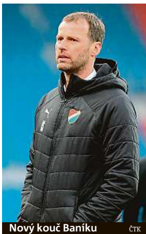
Nový kouč Baníku