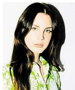
Lana Del Rey

Vlastním jménem Elizabeth Woolridge Grantová vyrůstala v New Yorku, kde původně snila o tom, že se stane básníčkou. Po rodičích však zdědila i zálibu v hudbě.