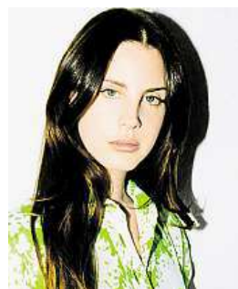
Lana Del Rey

Vlastním jménem Elizabeth Woolridge Grantová vyrůstala v New Yorku, kde původně snila o tom, že se stane básníčkou. Po rodičích však zdědila i zálibu v hudbě.