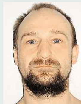
Uprchlý vězeň POLICIE ČR

Policie v Karlovarském kraji pátrá po vězni z věznic v Kynšperku nad Ohří, který v úterý večer utekl z nestřeženého pracoviště ve firmě v Chebu. Muž je vysoký 180 centimetrů, silnější postavy, na levém předloktí má tetování a má narezlé vousy. V době, kdy odešel z nestřeženého pracoviště, měl na sobě šedý vězeňský kabát a oranžovou firemní vestu, uvedl policejní mluvčí Michal Záček. „Muž byl odsouzen k nepodmíněnému trestu odnětí svobody za majetkovou trestnou činnost," uvedl Záček. S informací o pobytu nebo pohybu hledaného se lidé mohou obracet na linku 158 nebo na nejbližší policejní služebnu. ČTK