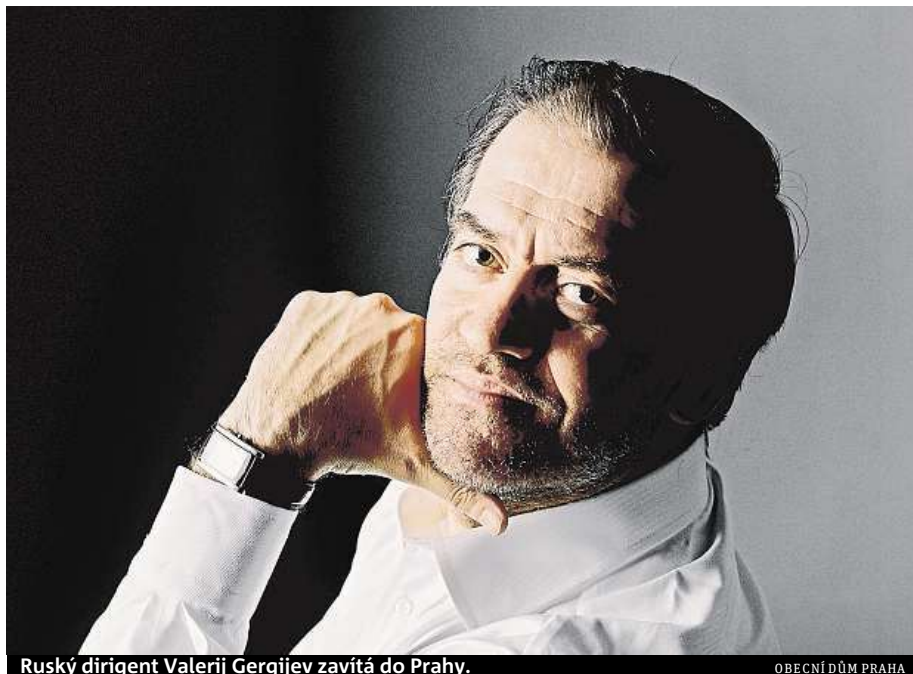
Ruský dirigent Valerij Gergijev zavítá do Prahy.

Symfonický orchestr Mariiinského divadla patří k nejstarším v Rusku. Jeho historie navazuje na první petro-