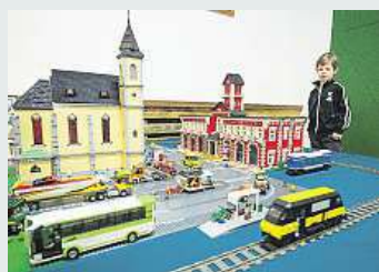
Modely sestavené z kostiček slavné stavebnice