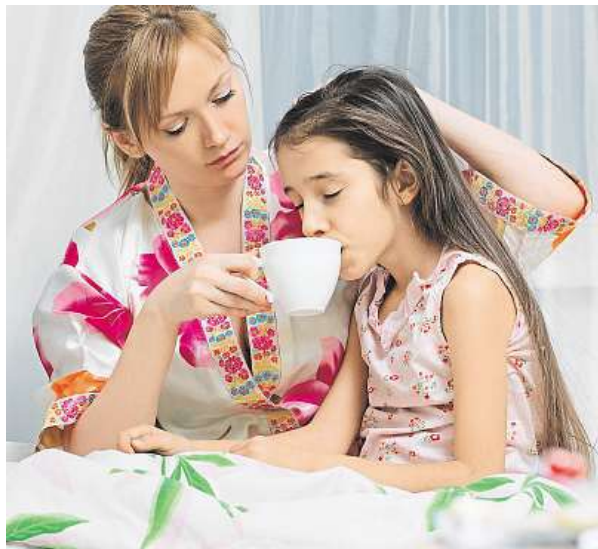
S nemocným dítětem jsou doma častěji matky.

„Z průzkumu také vyplývá, že do desátého roku dítěte stráví rodič na nemocenské péči o potomka 11 měsíců. To je skoro roční výpadek příjmu, o který se tak rodina připraví,“ říká Ivana Buriánková, mluvčí České pojišťovny. Polovina rodin výpadek neřeší a počítá s tím, že se následující měsíc uskromní. Více než třetina lidí má pro tyto případy finanční rezervu a část si musí napracovat přesčas. MET