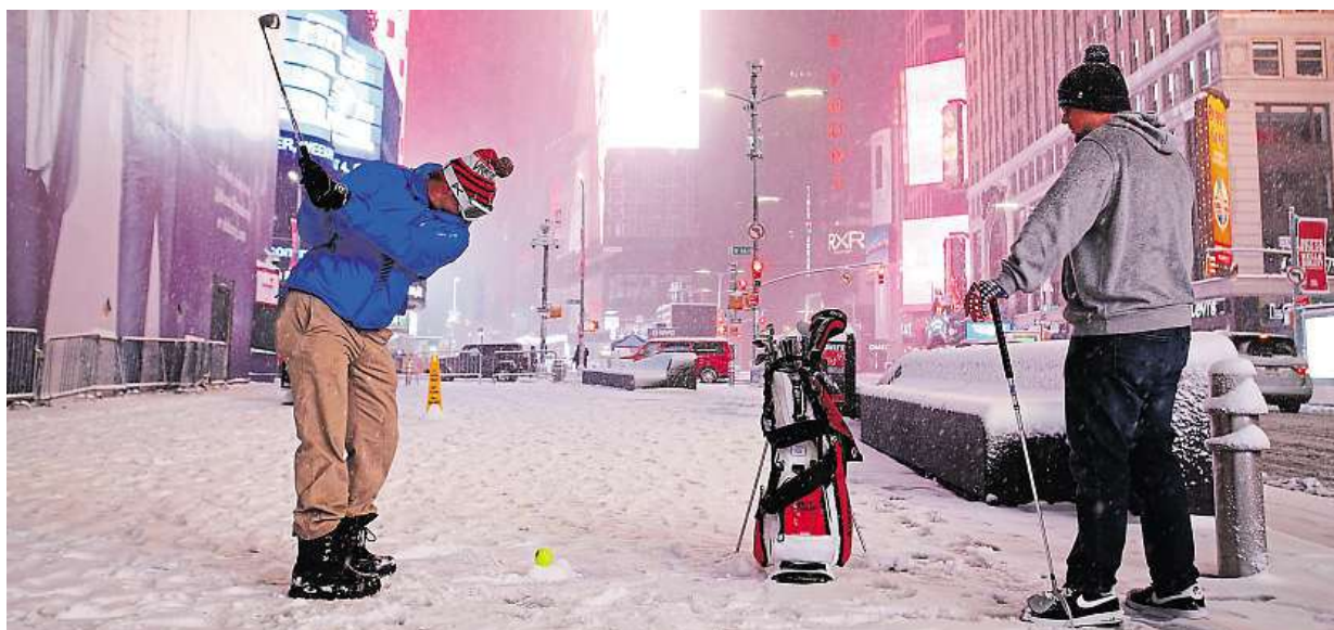
Na východní pobřeží USA dorazila silná sněhová bouře Stella. V New Yorku je její dopad zatím slabší, sních tu lidi hlavně baví.

Cigaretové špačky. Jsou jich plné ulice, Pardubice za jejich úklid platí „sběrače“. Protikuřácký zákon. Až začne platit, vyžene kuřáky před hospody. Příprava. Košů na oharky přibude, přispějí na ně i radnice STRANA 6