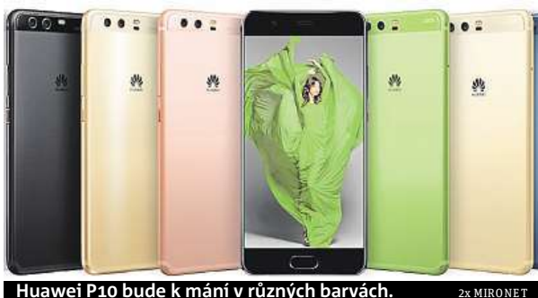
Huawei P10 bude k mání v různých barvách.

„Pě desítku“ opět definuje precizní design, celokovové tělo a pokročilý duální fotoaparát vyvinutý ve spolupráci s legendární společností Leica. Díky tomu můžete fotografie bez nadsázky přiblížit k profesionálním výstupům z digitálních zrcadlovek.