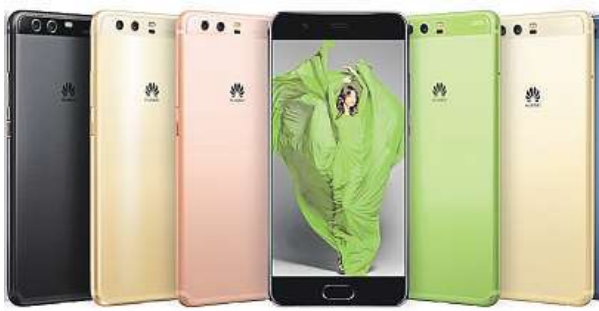
Huawei P10 bude k máni v různých barvách.

„Pě desítku“ opět definuje precizní design, celokovové tělo a pokročilý duální fotoaparát vyvinutý ve spolupráci s legendární společností Leica. Díky tomu můžete fotografie bez nadsázky přiblížit k profesionálním výstupům z digitálních zrcadlovek.