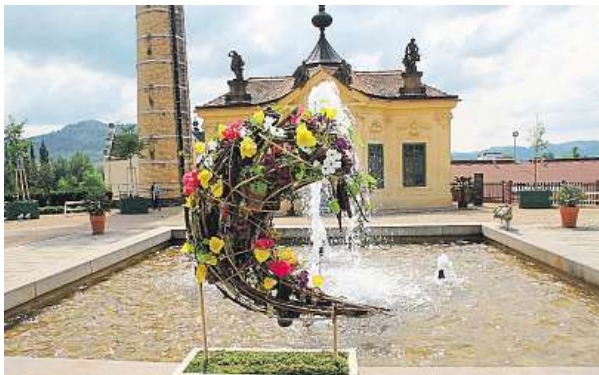
Odemykání zámeckých zahrad se koná na apríla.

Od začátku dubna se však můžou návštěvníci těšit také na zámecké zahrady včetně novinek v Jižních zahradách. „Zámecký program připravujeme každý rok tak, aby neje-