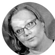
Inka Inčula Nejspíš si tu jednu cigaretu za měsíc při sedánku odpustím.