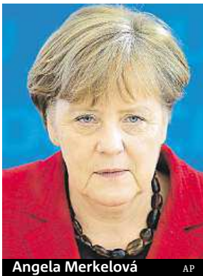
Angela Merkelová

„Hlavní důvod je uprchlická politika. Z toho se nejdě vmluvit,“ hodnotil výsledek voleb bavorský premiér Horst Seehofer. „Musíme lidem říci, že jsme je pochopili