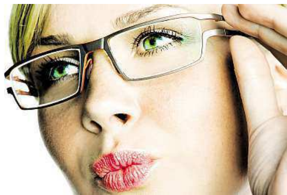
Progresivní brýlové čočky mohou vypadat skvěle.

Celodenní namáhání očí a oddalování předmětů bez vhodné korekce do dohledné vzdálenosti může způsobovat neostře vidění, bolesti hlavy, pálení a řezání očí a v neposlední řadě také vrásky z nadměrného mhouření očí. Optimální řešení při korekci presbyopického zraku poskytují progresivní čočky.