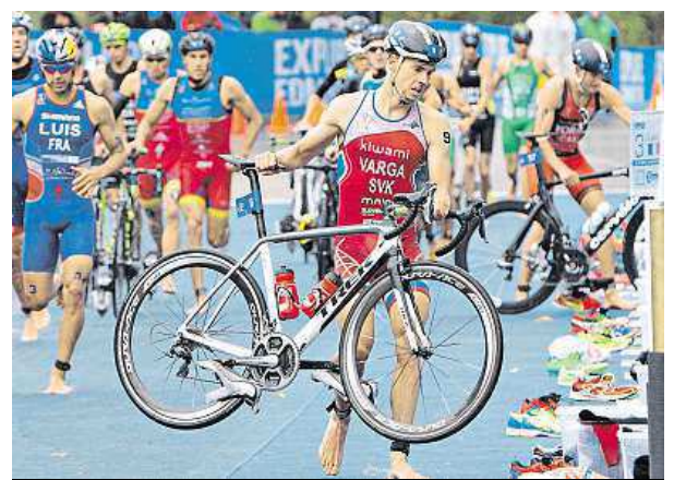
The second transition is after the cycle ride.

Find these words in the grid: swimming, cycling, running, endurance, transition, chip, stage, mount