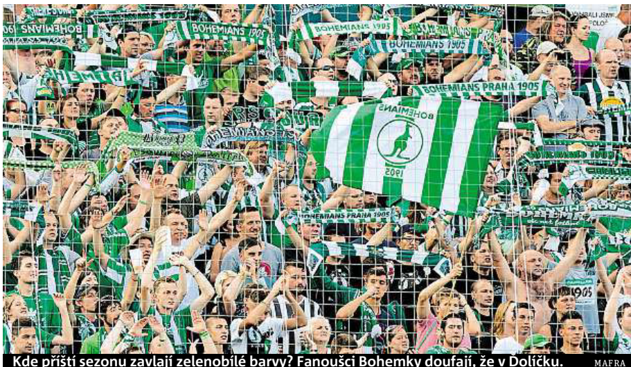
Kde příští sezonu zavlaží zelenobílé barvy? Fanoušci Bohemky doufají, že v Ďolíčku.