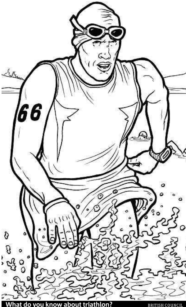
What do you know about triathlon? BRITISH COUNCIL

No! And they don't rest. They go from one event onto the next as quickly as possible. Some contestants even leave their shoes already on their bike pedals. This means that when they finish the swimming, they can start the cycling really quickly.