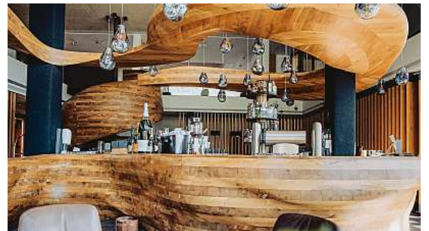
Pokud vám budou nějak povědomá kapková světla nad velkým vyřezávaným barem, vězte, že jsou z české sklárny Bomma. 2x PURADIES