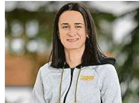
Martina Sáblíková

„Před mistrovstvím světa se cítím docela dobře. Myslím si, že jsme snad odtrénovali, co jsme měli, a na ledě se mi jezdí fajn. Takže doufám, že to tak bude i ve čtvrtek a v neděli,“ řekla Sáblíková, kterou poslední den šampionátu čeká start na trati