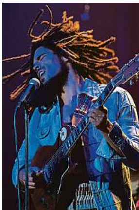
Ben-Adir je od Marleyho občas k nerozeznání.

Film Bob Marley: One Love zachycuje patrně nejznámější a divácky nejatraktivnější část zpěvákova života. Na začátku filmu potkáváme titulního hrdinu v okamžiku, kdy už je jamajským národním