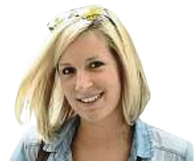
TROTAMUNDOS VĚČNÁ CESTOVATELKA A OBDIVOVATELKA ZAJÍMAVÝCH KULTUR

li zpět do vesnice a byla jsem smířená s tím, že tentokrát to zase nevyjde, stal se malý zázrak. Objevili jsme samičku lenochoda tříprstého odpočívající na stromě v úrovni našich očí. Majestátně se držela jednoho stromu a za druhý se protahovala, mžourala na nás a úplně se usmívala. Lenochodí obličej má velmi vtipný výraz a k tomu šedivo-bílé tělo, které jsem vždy viděla jen v klubku, no prostě jsem se musela také smát. Měla jsem touhu lenochoda obejmout, ale to se samozřejmě nemění, takže jsem si asi z metrové vzdálenosti užívala ty výhledy a byla vděčná za svůj další splněný sen.