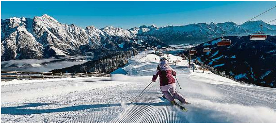
Pohodové lyžování s dětmi i FIS výzvy pro profesionály