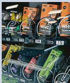
HHC automat MAFRA

Zákaz produktů s HHC vrátí Česko několik let nazpět.