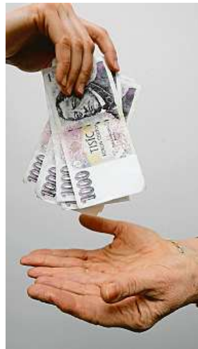
Štěstí a spokojenost často měříme jen přes peníze.

Tolik procent Čechů nosí v peněžence jako záruku štěstí a finančního zajištění kapří šupinu. PH