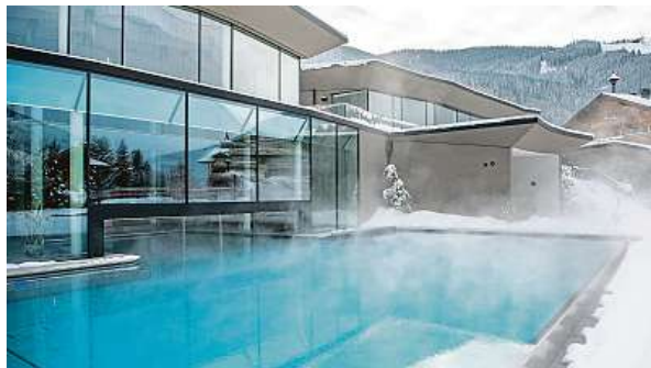
Do venkovního bazénu je vstup prosklenou stěnou z vnitřního bazénu. Součástí spa jsou odpočívárny připomínající relaxační ostrůvky.

Jen tolik eur stojí sobotní celodenní skipas do střediska Skicircus Saalbach Hinterglemm Leogang Fieberbrunn pro mladé narozené mezi roky 2005 a 2007, jestliže mají kartu Junior Xplore Card. Děti narozené v roce 2018 a později jezdí zdarma.