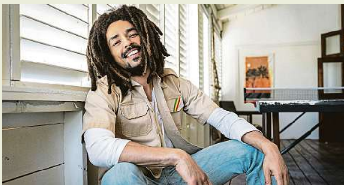
Bob Marley (Kingsley Ben-Adir) byl bezesporu jednou z největších muzikantských ikon dvacátého století. Bude jeho filmová biografie stát za to?

Bob Marley při běhu v newyorském Central Parku v roce 1980 zkolaboval. Rakovina, kterou trpěl, se rozšířila do mozku, jater i plic. Zemřel 11. května roku 1981 v nemocnici v Miami na Floridě. Jeho poslední slova patřila synovi Ziggymu: „Za peníze život nekoupíš.“