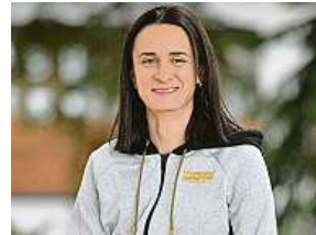
Martina Sáblíková

„Před mistrovstvím světa se cítím docela dobře. Myslím si, že jsme snad odtrénovali, co jsme měli, a na ledě se mi jezdí fajn. Takže doufám, že to tak bude i ve čtvrtek a v neděli,“ řekla Sáblíková, kterou poslední den šampionátu čeká start na trati