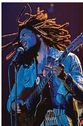
Ben-Adir je od Marleyho občas k nerozeznání.

Film Bob Marley: One Love zachycuje patrně nejznámější a divácky nejatraktivnější část zpěvákova života. Na začátku filmu potkáváme titulního hrdinu v okamžiku, kdy už je jamajským národním