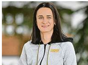
Martina Sáblíková

„Před mistrovstvím světa se cítím docela dobře. Myslím si, že jsme snad odtrénovali, co jsme měli, a na ledě se mi jezdí fajn. Takže doufám, že to tak bude i ve čtvrtek a v neděli,“ řekla Sáblíková, kterou poslední den šampionátu čeká start na trati