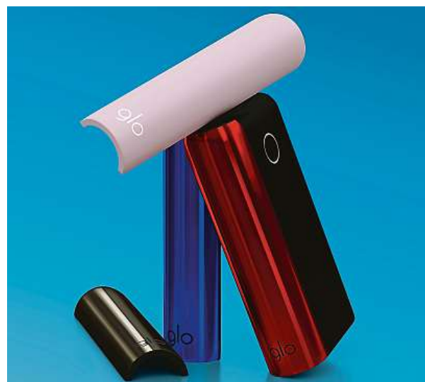
Od růžové přes perlovou bílou po tóny chromatické černé

povat i další barevné varianty bočních krytů za cenu 100 korun za jeden kryt.