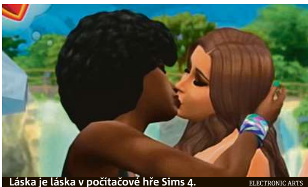
Láska je láska v počítačové hře Sims 4.

Zatímco většina rodičů je vděčná, když si jejich dítě mezi všemi populárními střílečkami vybere ke hraní na počítači mírumilovnou hru The Sims 4, v Rusku se smí prodávat jen plnoletým. „Silně stylizovaná hra s virtuálními postavami by totiž mohla ohrozit mravní vývoj mladistvých. Protože je v ní možné navazovat homosexuální vztahy,“ zdůvodňuje opatření herní publicista Honza Šrp. A upozorňuje na chystané rozšíření The Sims 4, nazvané „Svatební příběhy“. To vyjde již pozítří a v Rusku si jej pro jistotu nezahraje vůbec nikdo. „Vydavatelství Electronic Arts se rozhodlo,