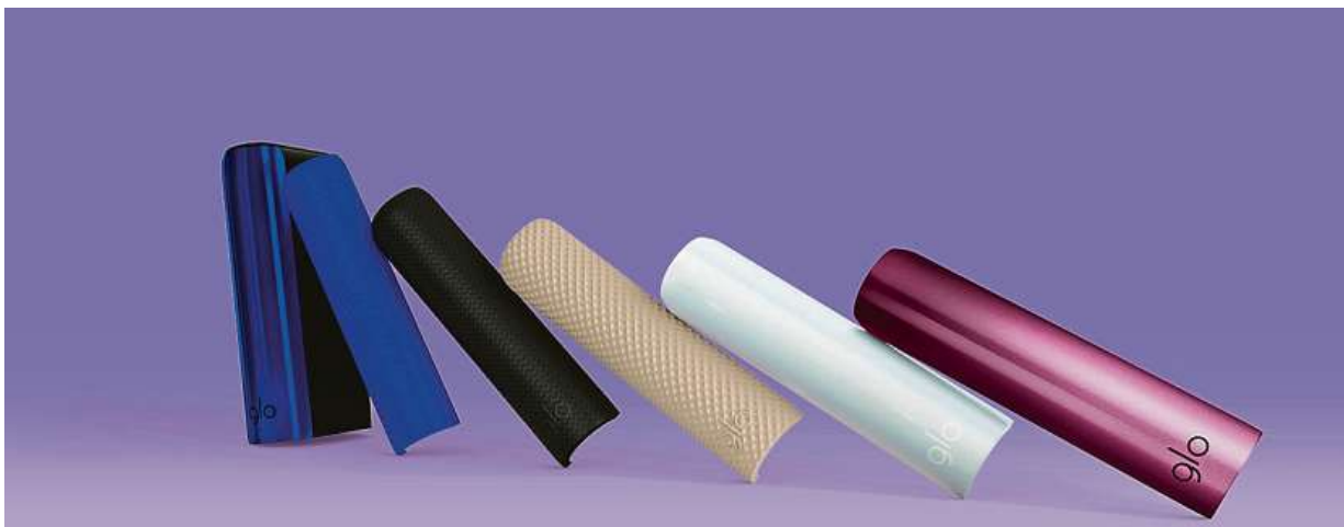
Zařízení na zahřívání tabáku glo hyper+ dostává nové přízvisko UNIQ a nové vyměnitelné boční kryty.

Zařízení na zahřívání tabáku glo hyper+ dostává nové přízvisko UNIQ a ke čtyřem stávajícím základním barvám – modré, černé, bílé a zlaté – přidává vyměnitelné boční kryty v celkem devatenácti barevných odstínech a provedeních. Od něžné růžové přes perlovou bílou až po tóny chromatické černé. Navíc může uživatel vybírat ze tří různých povrchových úprav krytů – nabí-