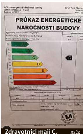
Zdravotníci mají C. MZCR

Velké firmy se stěhují stále víc do nových centrál, z nichž některé jsou téměř energeticky