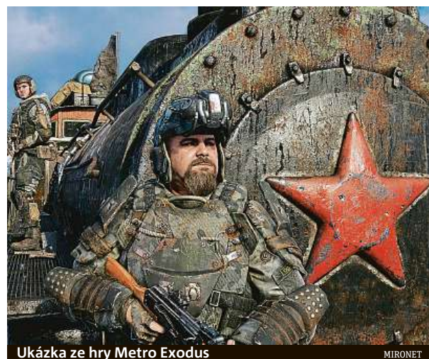
Ukázka ze hry Metro Exodus

Metro Exodus vychází pro PC a herní konzole PlayStation 4 a Xbox One. V internetovém obchodě Mironet ho můžete pořídit za 1299 korun pro PC a za 1499 korun pro obě konzole.