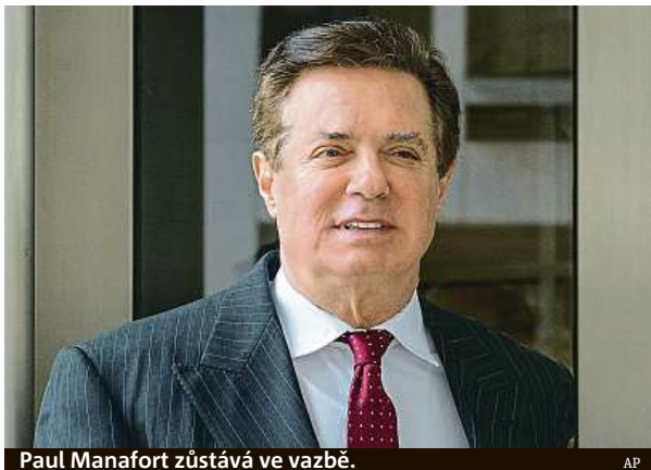
Paul Manafort zůstává ve vazbě.

Manafort je stále ve vazbě a čeká na vynesení rozsudku. Rozhodnutí soudkyně omezuje jeho šance na nižší trest. Verdikt má padnout 13. března. Soudkyně dospěla k závěru, že existují dostatečné důkazy pro to, že Manafort porušil dohodu o spolupráci s vyšetřovateli tím, že lhal ve třech z pěti předložených bodů. Ze lhaní vyšetřovatelům