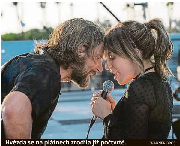
Hvězda se na plátnech zrodila již počtvrté.

Se svým názorem je ale bono22vox zatím v menšině. Snímek byl do tuzemských kin sice oficiálně uveden teprve včera, svou českou premiéru si však odbyl již minulý rok na karlovarském filmovém festivalu. Viděly ho tak