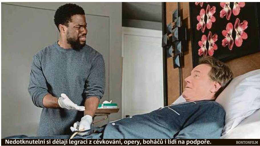
Nedotknutelní si dělají legraci z cévkování, opery, boháčů i lidí na podpoře.

Děj snímku Nedotknutelní, který si včera odbyl premiéru v českých kinech, vypráví o ochrnutém boháči Philippovi (Bryan Cranston). Ten si na jeho začátku vybere za svého nového opatrovníka hubatého černocha a bývalého kriminálníka v jenom Drisse (Kevin Hart) a začnou se dít věci. Jejich rozdílnost je totiž stejně tristiňá jako zábavná, a tak sledujeme spoustu eskapád, které spolu tihle dva zažívají. No