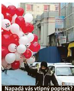
Napadá vás vtipný popisěk?

Napište bublinu a reagujte na sloupek na: www.facebook.com/denikmetro