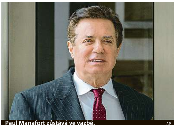
Paul Manafort zůstává ve vazbě. AP

Manafort je stále ve vazbě a čeká na vynesení rozsudku. Rozhodnutí soudkyně omezuje jeho šance na nižší trest. Verdikt má padnout 13. března. Soudkyně dospěla k závěru, že existují dostatečné důkazy pro to, že Manafort porušil dohodu o spolupráci s vyšetřovateli tím, že lhal ve třech z pěti předložených bodů. Ze lhaní vyšetřovate-