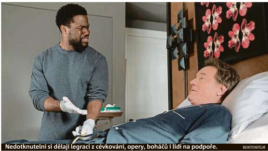
Nedotknutelní si dělají legraci z cévkování, opery, boháčů i lidí na podpoře.

Děj snímku Nedotknutelní, který si včera odbyl premiéru v českých kinech, vypráví o ochrnutém boháči Philippovi (Bryan Cranston). Ten si na jeho začátku vybere za svého nového opatrovníka hubatého černocha a bývalého kriminálníka v jenom Drisse (Kevin Hart) a začnou se dít věci. Jejich rozdílnost je totiž stejně tristiňá jako zábavná, a tak sledujeme spoustu eskapád, které spolu tihle dva zažívají. No