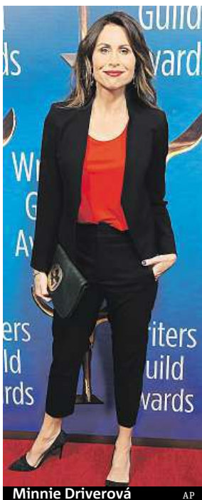
Minnie Driverová

Evansová zároveň Oxfam obvinila, že její upozornění na chování některých zaměstnanců nebrala organizace dostatečně vážně. Aktuální obvinění se objevila krátce poté,