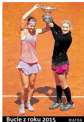
Bucie z roku 2015 MAFRA