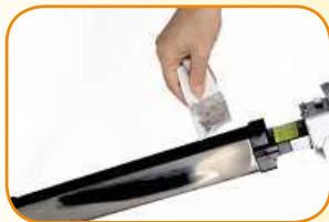
Filtr není třeba nikdy vyměňovat! Stačí ho jen jednoduše vyjmout a otřít. Účinek filtrace ihned vidíte!