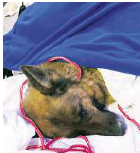
Fenka Rapunzel

Rapunzel nechtěla ke zvěrolékaři v blízkosti Frankfurtu. Zvířeti se podařilo 15. srpna 2017 otevřít dveře a utéci od zvěrolékaře mezi Frankfurtem a Aschaffenburgem. Podle svědků se zprvu vydala na správnou světovou stranu