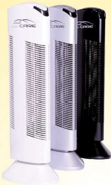
Čističku vzduchu Ionic-CARE Triton X6 můžete zakoupit ve třech barevných provedeních.

cena 3.490 Kč/ks cena 3.290 Kč/ks od 2 ks