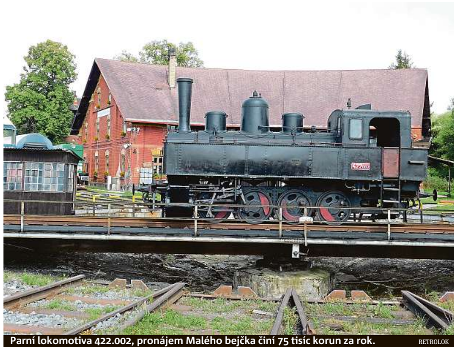
Parní lokomotiva 422.002, pronájem Malého bejčka činí 75 tisíc korun za rok.

V současnosti nejvíc pracuje Turkova parta na opravě kotle. „Je zapotřebí změřit tloušťky stěn, jestli se může původní kotel ještě využít,