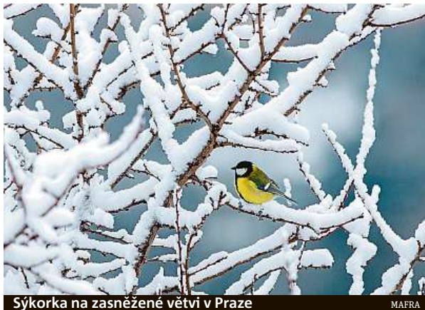
Sýkorka na zasněžené větvi v Praze

Zimní kolo soutěže Živá zahrada proběhlo tradičně během vánočních svátků. Lidé na svých zahradách zapisova-