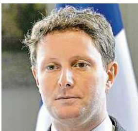
Clément Beaune

Na Maltě a v Irsku. Pouze v těchto zemích EU je angličtina mateřským jazykem.