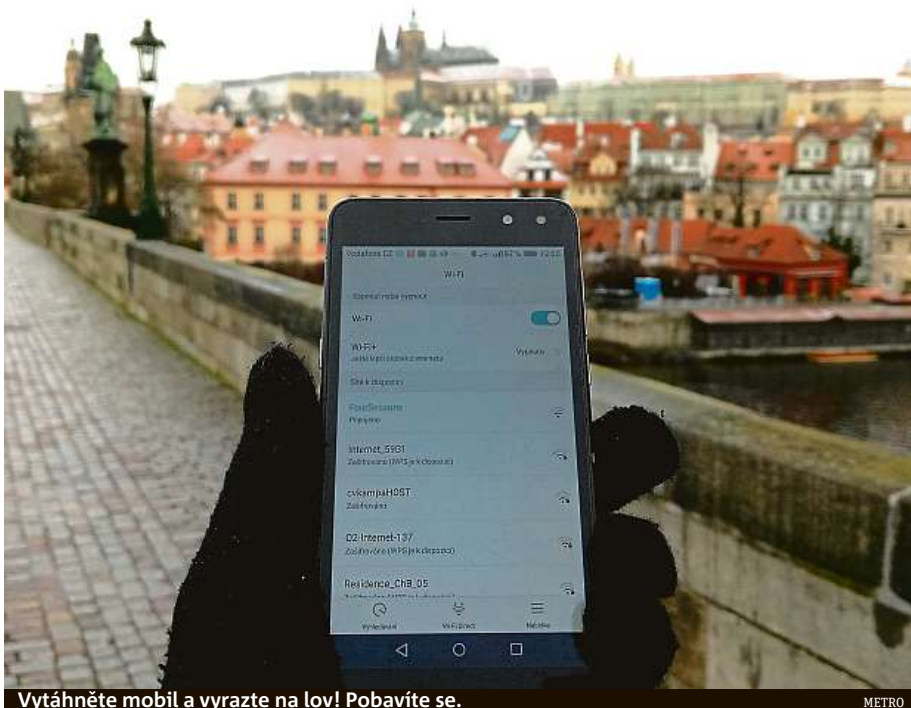
Vytáhněte mobil a vyrazte na lov! Pobavíte se.

Pro rodiče máme upozornění. Vydají-li se na lov i s caparty, asi budou muset některé názvy taktně přecházet, nebo naopak přemýšlet, jak dětem vysvětlit, co tím autoři mysleli (viz jeden z boxů). Někde je to totiž s pojmenováváním bezdrátového připojení až, jak se říká, po dvaadvacáté hodině.