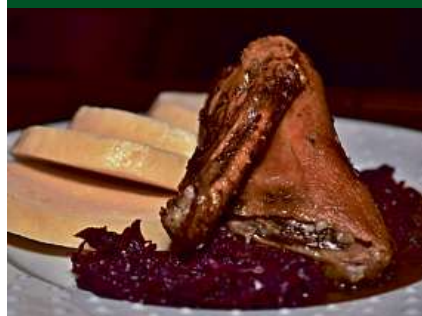
Čtvrtka pečené kačeny se zelím