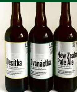
Prodej řemeslných piv v balení sklo, PET a KEG s možností zapůjčení výčepu