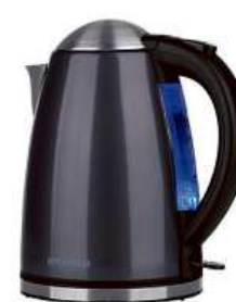
Rychlovarná konvice HYUNDAI VK 301 A

Příkon 2 200 W • objem 1,7 l • skryté topné těleso pod rovným nerezovým dnem • omyvatelné filtrační sítko proti usazeninám vodního kamene • dvojnásobný bezpečnostní systém