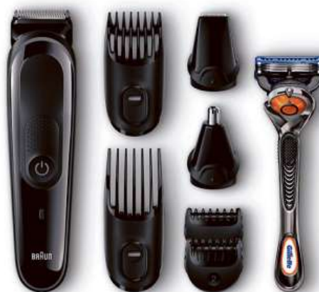
Zastříhovač vousů BRAUN MGK3060

Ostré břity s doživotní trvanlivostí • plně omyvatelný (Wet/Dry) • akumulátorový/síťový provoz • 8 nástavců • žiletka Gillette v balení