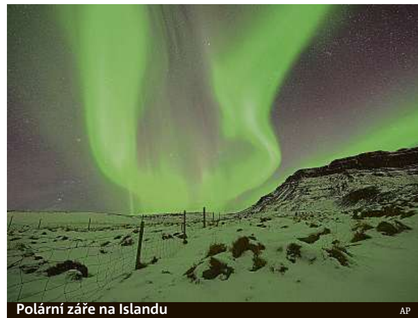
Polární záře na Islandu

denním pozorování solárního větru. Následuje doporučení, na kterém místě na Islandu bude zřejmě možné záři pozorovat. K tomu je třeba odjet do oblastí vzdálených od městského osvětlení, takže se mnozí motoristé ocitají na nebezpečných horských silnicích. Policisté se setkávají s velmi ospalými řidiči i s těmi, kteří jedou bez zapnutých světel ve snaze vidět záři lépe. Nehody se ale stávají i na hlavních tazích, kdy řidiči při spatření záře prudce zabrzdí, načež následuje náraz auta jedoucího vzhledu. ČTK