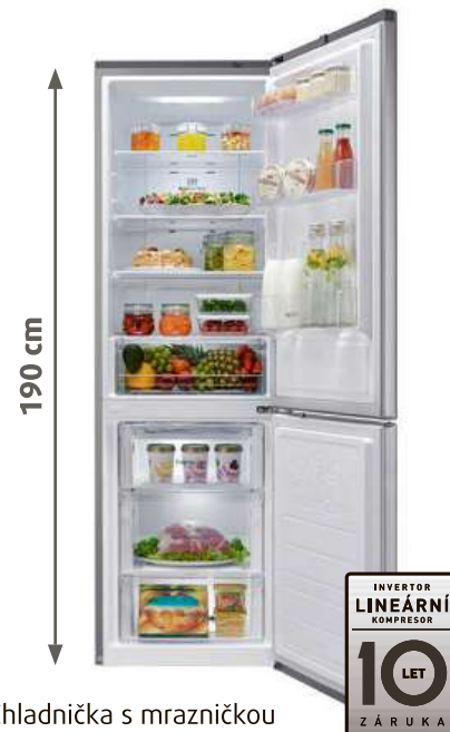
Chladnička s mrazničkou LG GBB59PZDS

Objem 225 l / 93 l • hlučnost 37 dB • Multi Air Flow – rozšířené proudění chladného vzduchu • Moist Balance Crisper™ – udržení optimální úrovně vlhkosti (ovoce + zelenina) • expresní mrazení, dětský zámek, alarm otevřených dveří, ochrana dveřního těsnění – zabránění růstu plísní