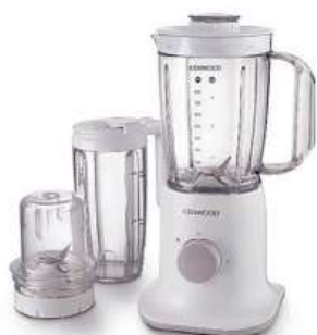
Stolní mixér KENWOOD BLEND-XTRACT BL237

Příkon 350 W • 2 rychlosti + funkce puls • 4 nerezové nože pro optimální extrakci živin • cestovní nádoba na smoothie o objemu 450 ml • multi mlýnek na bylinky či ořechy