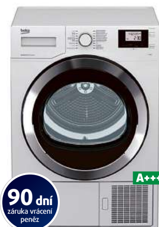
Sušička prádla BEKO DS7534CSRX1

Kapacita 7 kg • nerezový bubon Aquawave pro šetrné sušení • automatická ochrana proti zmačkání, senzor sušení, vnitřní osvětlení • český popis programu na panelu • hloubka 58,9 cm