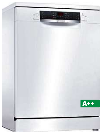
Myčka nádobí BOSCH SUPER SILENCE SMS46KW05

Kapacita 13 jídelních sad • 6 programů, 6 mycích teplot • 2 speciální funkce: VarioSpeed Plus, extra sušení • dávkovací asistent, AquaSensor, senzor naplnění • šířka 60 cm