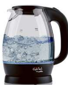
Rychlovarná konvice GALLET MONTARGIS BOU786

Příkon 2 200 W • objem 1,7 l • skleněné provedení s vnitřním osvětlením • topné těleso pod rovným nerezovým dnem • filtrační sítko proti usazeninám vodního kamene