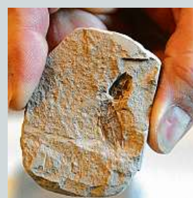
Nové exponáty – nejstarší brouk (vlevo)