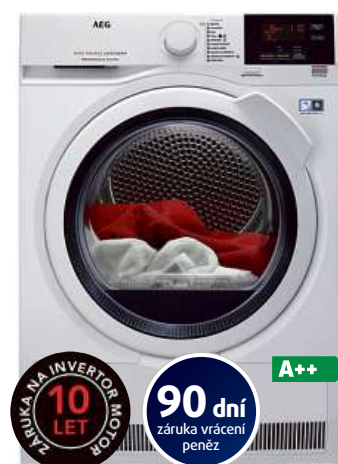
Sušička prádla AEG ABSOLUTE CARE® T8DBG48WC

Kapacita 8 kg • funkce Protí pomačkání • technologie ProSense optimalizuje délku sušení a spotřebu energie • technologie SensiDry odstraní vlhkost z tkanin při poloviční teplotě • hloubka 60 cm