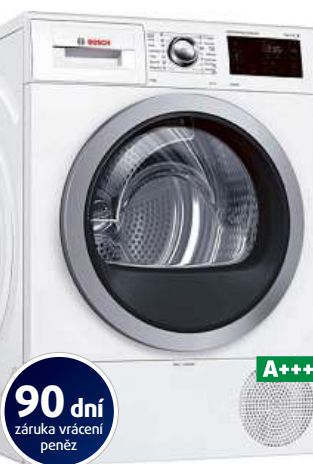
Sušička prádla BOSCH WTW876WBY

Kapacita 8 kg • systém šetrného sušení SensitiveDrying • technologie AutoDry zabrání sražení • samočisticí kondenzátor • režim pro alergiky, studené sušení • hloubka 59,5 cm