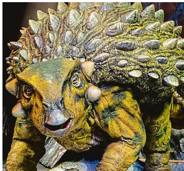
Organizátoři slibují realistický zážitek.