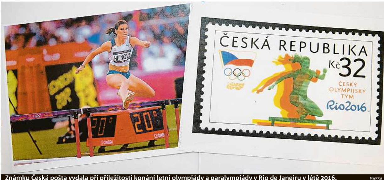
Známku Česká pošta vydala při příležitosti konání letní olympiády a paralympiády v Rio de Janeiru v létě 2016. MAFRA