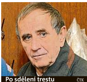
Po sdělení trestu ČTK

První Čech odsouzený za terorismus dostal čtyři roky vězení.