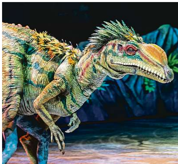
Každý dinosaurus je ovládnán několika lidmi.