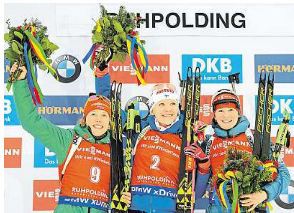
Stupně vítězů: Dahlmeierová, Mäkäräinenová a Vítková AP

V mužském „hromadačku“ byl Michal Šlesingr díky bezchybné střelbě osmý. Michal Krčmář obsadil šestnáctou příčku, Ondřej Moravec skončil až osmadvacátý. ČTK