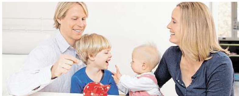
Myslete také na děti.