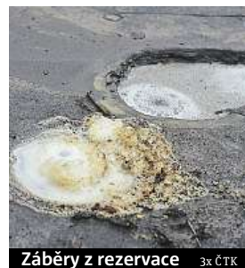
Záběry z rezervace

nou investicí bude vybudována nového parkoviště. Výstavba by měla začít na jaře a do konce roku by mělo být nové centrum hotovo. Stavět se bude za běžného provozu rezervace, město proto připra-