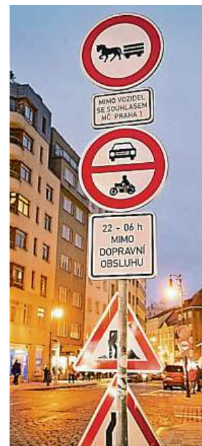
Radnice MČ Praha 1 omezila vjezd do Starého Města.