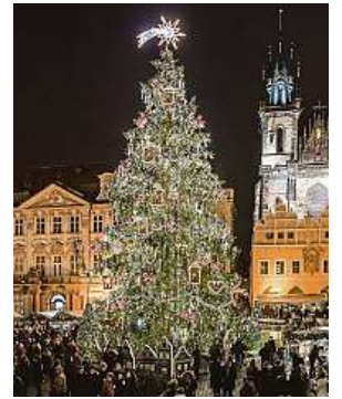
Osvětlení vánočního stromku na Staroměstském náměstí v Praze