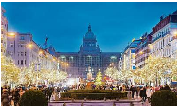
Historie LED světél sahá až do 20. století. Jejich vývoj přinesl revoluci v energeticky úsporném a dlouhotrvajícím osvětlení.

V roce 1962 přišel americký inženýr Nick Holonyak mladší s prvním praktickým využitím. Jeho červená LED dioda byla založena na materiálu zvaném gallium arsenid fosforečnan gallia (GaAsP), který umožnil produkci světla v červeném spektru. Schopnost diod vyzařovat světlo byla využívána i k signalizaci různých stavů zařízení.