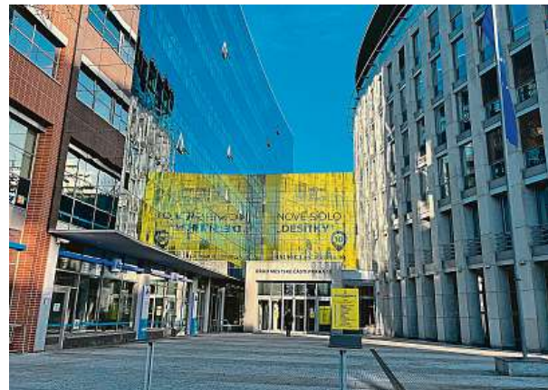
Nájemní vztah ve Vinohradské je formulován tak, aby se městská část mohla z nájmu po uplynutí základní doby bezproblémově vyvázat, nebo naopak dále pokračovat. Maximální doba nájmu činí sedm let. 2x PRAHA 10