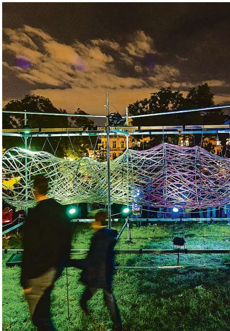
Díky LED osvětlení vznikají také díla na nejrůznější světelné festivaly.

• Inovace v designu – Inovace v designu umožňují vytvářet osvětlení, které nejen svítí, ale i tvaruje prostor a vytváří jedinečnou atmosféru. MET