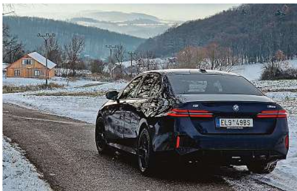
Elegance tomuto sedanu nechybí. Povedený je sklon vika kufru. Typické BMW ledvinky na masce mají ledkový svítící rámeček.

My jsme v rámci prezentace pro novináře projeli jak dieselovou variantu této osmé generace modelu, tak elektrickou variantu, která je v této řadě nabízena vůbec poprvé. Pětkový bavorák je ale nejrychlejší ve své vrcholné elektrické formě – BMW i5 M60 xDrive disponuje výkonem až 600 koní a 795 Nm, což mu dává schopnost zrychlit z nuly na stovku za 3,8 sekundy. Bate-