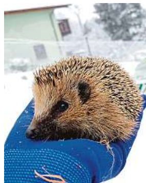
Zachránění. Poštołka, syseł a jezek. Letos zvířecích pacientů výrazně přibylo.