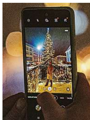
Trhy lákají k návštěvě.

Pojišťovny připomínají, že Češi by neměli zapomínat na cestovní pojištění i při krátkodobých zahraničních cestách. Ačkoli je totiž cestovní pojištění pro velkou část Čechů samozřejmostí, u kratších zahraničních výletů je často považují za zbytečnost. I během těchto akcí se však