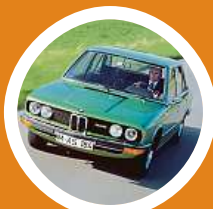
BMW 525 (E12)