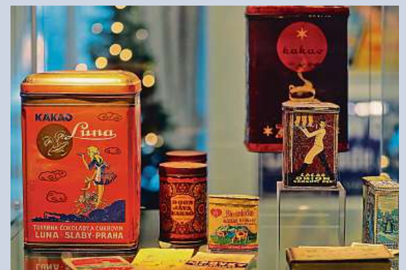
Historie čokolády v muzeu v Karlových Varech