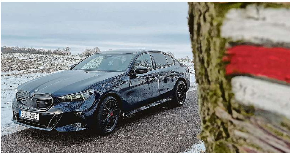
BMW i5 je dokonalý elektrický manažerský sedan. Konkurence v podobě Mercedesu EQE nebo Tesly Modelu S má velký problém. Důstojným soupeřem je také elektrické Porsche Taycan Turbo S.