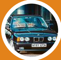
BMW 5 Sedan (E34)