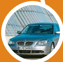
BMW 545i Sedan (E60)