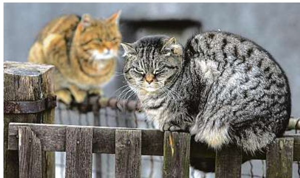
Venkovní kočka, která po celý rok tráví spoustu času venku, se připravuje na zimu tím, že mění srst a přibírá na váze.

Jejich vliv na volně žijící živočichy vyvolal na Novém Zélandu ostrou debatu, v níž jeden politik vede kampaň za jejich úplné vyhubení, a kontroverze se rozpoutala i kvůli soutěžím, které nabádaly děti ke střelení koček.