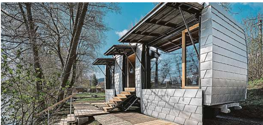
Říční saunu najdete u břehu Svatky v brněnském Jundrově. Obřích okna byla pro její autory zcela zásadní.