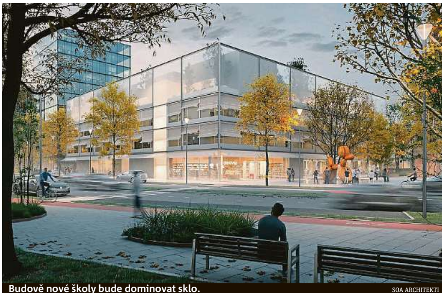
Budově nové školy bude dominovat sklo.

V areálu Nové Zbrojovky vyrostou základní a mateřská škola na základě návrhu od ateliéru SOA architekti. V polovině listopadu ho v soutěži pořádané Kanceláří architekta města Brna vybrala odborná porota. „Vítězný návrh podněcuje komunitní život místa. Tři nové budovy jsou obklopené dostatečně velkým veřejným prostranstvím a pěším nabízí maximální přístupnost. Přízemí základní školy s dvorem je pojato velkoryse a bude možné ho zcela otevřít. Škola se zahradou a sportovním areálem se tak propojí se životem obyvatel nové čtvrti. Podobně bude celý kom-