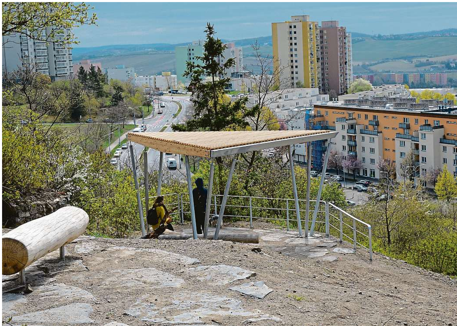
Od roku 2017 bylo v rámci participativního rozpočtu Dáme na vás dokončeno 35 vítězných projektů za 63 milionů korun, třeba i park u Kamenného vrchu. METRO