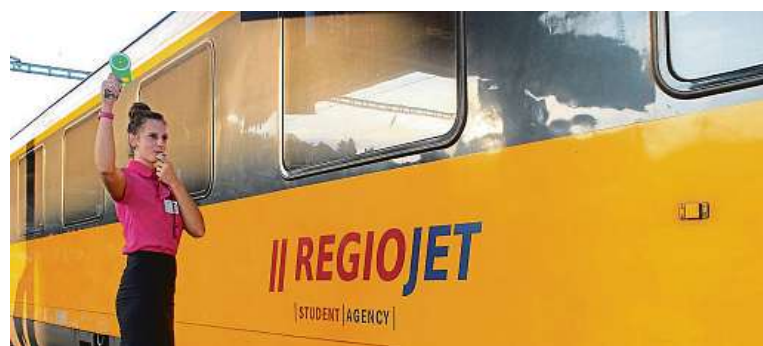
Na letišti Schwechat cestujte rychle a pohodlně.