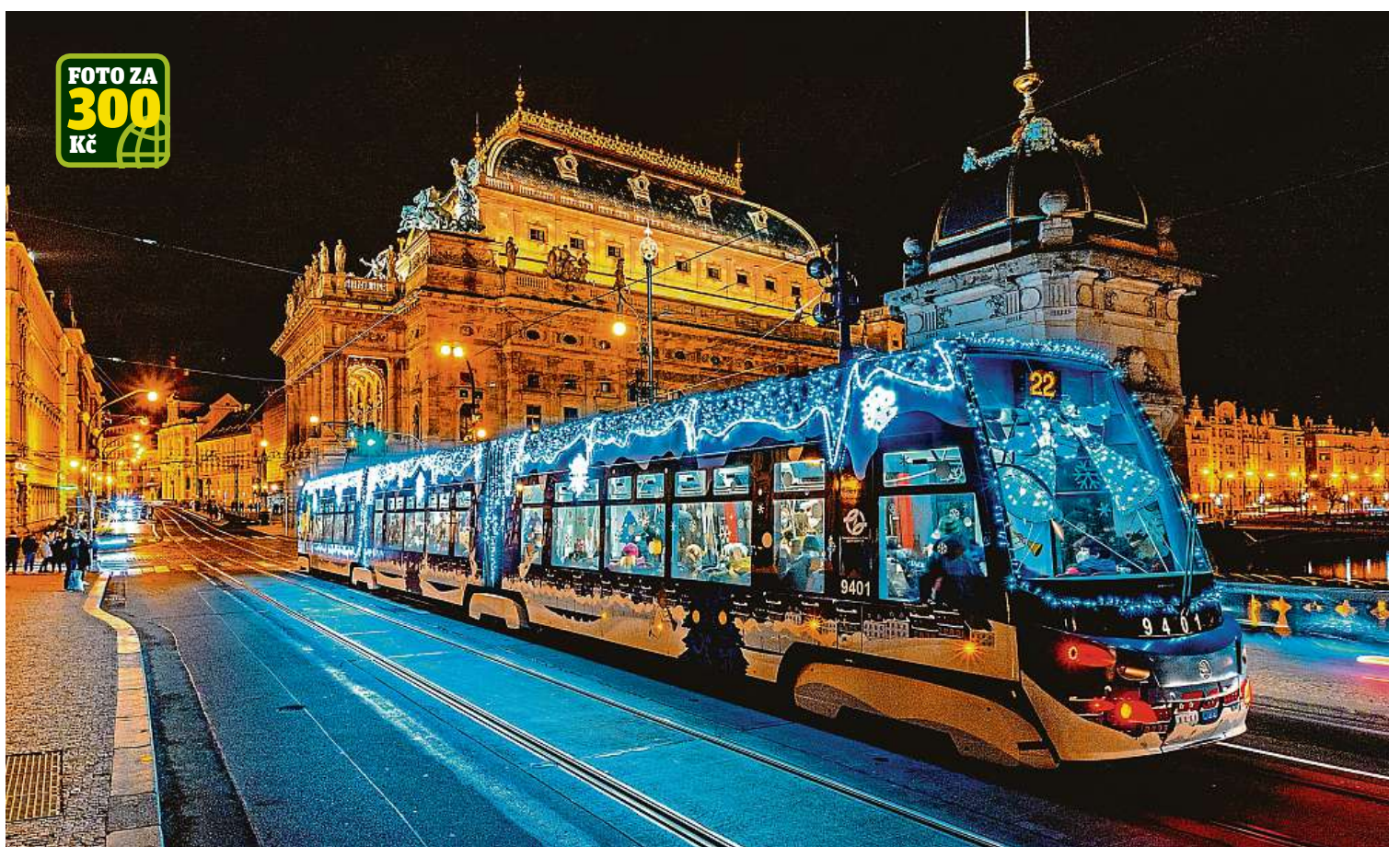
FOTO ZA 300 Kč

Neběhají, neplavou. Jen pět procent dětí se podle průzkumu během covidového omezení hýbe, jak má. Fyzioterapeuti. Bolavá záda od sezení u konzolí jsou běžnou záležitostí. Tloustneme. Varující čísla STRANA 7