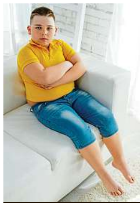
Obézní dítě

Doporučené množství denní pohybové aktivity je podle odborníků jedním z klíčových faktorů ovlivňujících zdraví v průběhu celého života. „V praxi jsem se naučila ro-