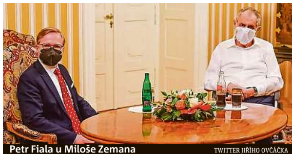
Petr Fiala u Miloše Zemana