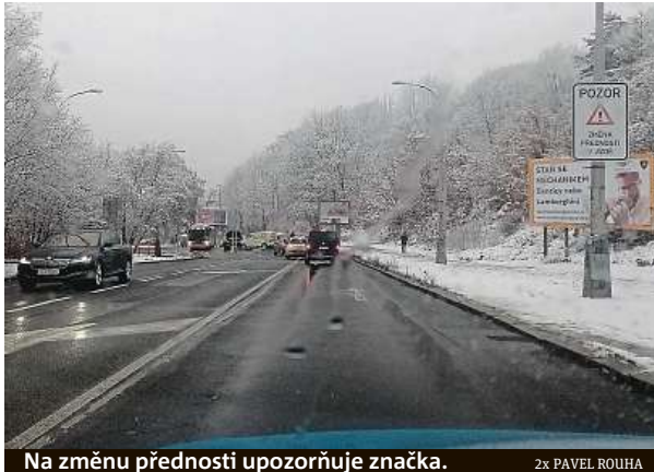
Na změnu přednosti upozorňuje značka.

„Pokud chtějí křižovatku zachovat tak, jak je teď, měla by být upozornění na změnu režimu a předností minimálně podstatně výraznější,“ dodává čtenář. Deník Metro se obrátil na několik institucí, aby zjistil, kdo je za opatření zodpovědný. Kritika, která