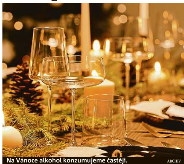
Na Vánoce alkohol konzumujeme častěji.