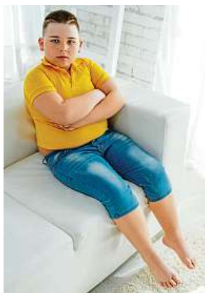
Obézní dítě

Doporučené množství denní pohybové aktivity je podle odborníků jedním z klíčových faktorů ovlivňujících zdraví v průběhu celého života. „V praxi jsem se naučila ro-