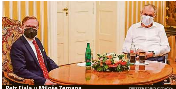
Petr Fiala u Miloše Zemana