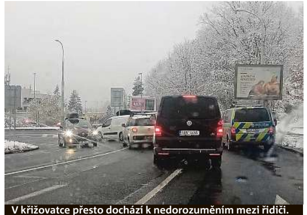
V křižovatce přesto dochází k nedorozuměním mezi řidiči.

souvisí s nepřehlednou křižovatkou, je totiž na sociálních sítích směřována především na Technickou správu komunikací (TSK). Ta ale podle své mluvčí Barbory Liškové za vzniklý problém nemůže.