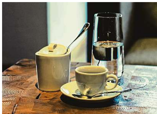
Káva, jeden ze tří nejoblíbenějších nápojů