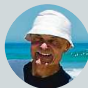
Petr Klimecký Výsledek voleb do Poslanecké sněmovny.