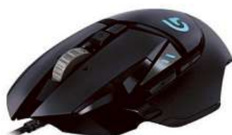
Myš LOGITECH GAMING G502 PROTEUS SPECTRUM

Herní optická myš • programovatelné podsvícení • nejcitlivější optický senzor • 11 programovatelných tlačítek • rolovací kolečko se dvěma režimy