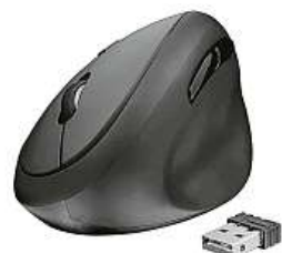
Trust Orbo 2x MIRONET

A mohou dokonce dobře vypadat. Příkladem je myš Trust Orbo Wireless. Tento přístroj ve tvaru oblázku udržuje dlaně přibližně v úhlu 45 stupňů, což je z hlediska ergonomie optimální. Také umístění ovládacích prvků je řešeno tak, aby se uživatel myš držela pohodlně i při delším nepřetržitém používání. Povrch myši Orbo je pogumovaný a má malou podporu pro palec. Kromě hlavních tlačítek a kolečka se na myši nachází také dvě tlačítka pod palcem. Myš je bezdrátová a váží jen 80 gramů. S počíta-