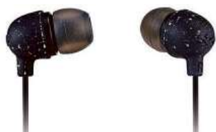
Sluchátka MARLEY LITTLE BIRD

Špuntová sluchátka • čistý zvuk • kabel, který se nezamotá • mikofon přímo na kabelu • jedotlačítkový ovladač