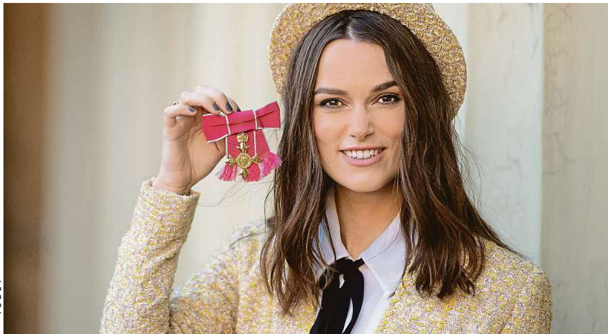
Herečka Keira Knightley včera v Buckinghamském paláci převzala Řád britského impéria za zásluhy o kulturu a charitu.

Experiment. Bankovní úředníci nemají u svých stolů odpadkové koše. Ekologie. Každé smetí má vlastní kontejner. Bez kelímku. Káva z automatu nebo svařák na večírku jsou do vlastního hrnečku levnější STRANA 2