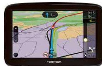
Navigační systém GPS TOMTOM VIA 52 EUROPE LIFETIME

5,0" dotykový displej • mapy Evropa 48 Lifetime – doživotní aktualizace ZDARMA • hlasové ovládání • hands-free • asistent jízdních pruhů • přepočítání trasy • alarm na rychlostní/ bezpečnostní kamery • Bluetooth • oboustranný integrovaný držák