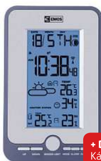
Meteostanice EMOS E0305C

Modře podsvícený displej • předpověď počasí • vnitřní a venkovní teplota i vlhkost • možnost připojit až 3 bezdrátová čidla - dosah až 30 m • čas řízen rádiovým signálem • datum • budík • možnost instalace na stěnu