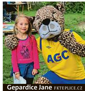
Gepardice Jane FKTEPLICE.CZ

Jablonec zastupuje sova Jizerka. Když ji klub v létě roku 2015 představoval, nej-