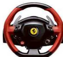
Volant + pedály THRUSTMASTER FERRARI 458 SPIDER

Kompatibilita Xbox One S, Xbox One, Xbox One X • automatické centrování • řazení pod volantem • realistická převodovka • podpora velké škály her