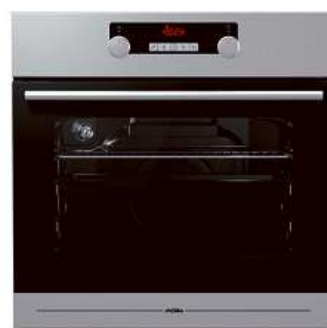
Vestavná trouba MORA VT 538 BX

Objem 65 l • 11 funkcí • speciální zamačkávací knoflíky, dotekové ovládání hodin • programování doby pečení • speciální program čištění trouby Eco Clean