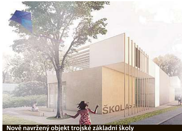
Nově navržený objekt trojské základní školy

neuvědomují, prostředí, ve kterém se nacházíme, ovlivňuje i naše pocity, nálady a chování,“ dodává.