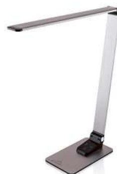
Stolní LED lampička ETA 489290000

Dotykové ovládání • nastavení teploty a jasu světla • USB napájení • dlouhodobá životnost • nízká spotřeba