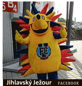
Jihlavský Ježour FACEBOOK

větší starost měl tehdy kustod Aleš Češek. „Nevím, kde na ni teď takhle narychlo seženu oblečení. Má velikost asi XXXXL,“ vtipkoval pro klubový web. Není to ledajaká sova, ale syc rousný, který je chráněný a žije v Jizerských horách. Také Jizerka se kromě zápasů na Střelnici věnuje různým aktivitám klubu. A ve fanshopu Jablonce si můžete koupit i její plyšovou verzi, přispějete tím na ochranu Jizerských hor.