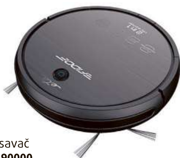
Robotický vysavač ETA FIDO 1512 90000

2v1 vysává i mopuje • vhodný pro úklid všech typů tvrdých podlah a koberec • výkonný Li-Ion akumulátor 14,4 V • 3 režimy čištění: automatický, pro malé místnosti, úklid podél stěn • inteligentní navigační systémy zabrání srážkám a pádu ze schodů