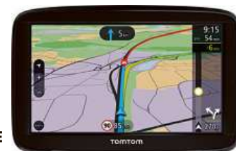
Navigační systém GPS TOMTOM VIA 52 EUROPE LIFETIME

5,0" dotykový displej • mapy Evropa 48 Lifetime – doživotní aktualizace ZDARMA • hlasové ovládání • hands-free • asistent jízdnic pruhů • přepočít trasy • alarm na rychlostní/ bezpečnostní kamery • Bluetooth • oboustranný integrovaný držák