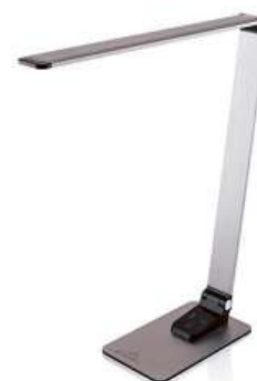
Stolní LED lampička ETA 489290000

Dotykové ovládání • nastavení teploty a jasu světla • USB napájení • dlouhodobá životnost • nízká spotřeba