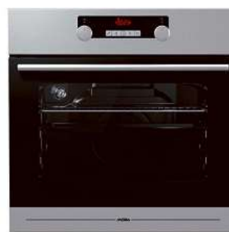
Vestavná trouba MORA VT 538 BX

Objem 65 l • 11 funkcí • speciální zamačkávací knoflíky, dotekové ovládání hodin • programování doby pečení • speciální program čištění trouby Eco Clean