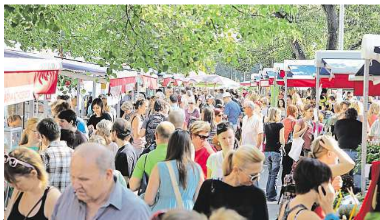
Farmářské trhy na náměstí Jiřího z Poděbrad jsou velmi oblíbené.

Farmářské trhy na náměstí Jiřího z Poděbrad změnil provozovatele. Městská část Praha 3 počítá s tím, že výherce výběrového řízení zvýší kvalitu a atraktivitu farmářských trhů, které patří v Praze mezi nejvyhledávanější.