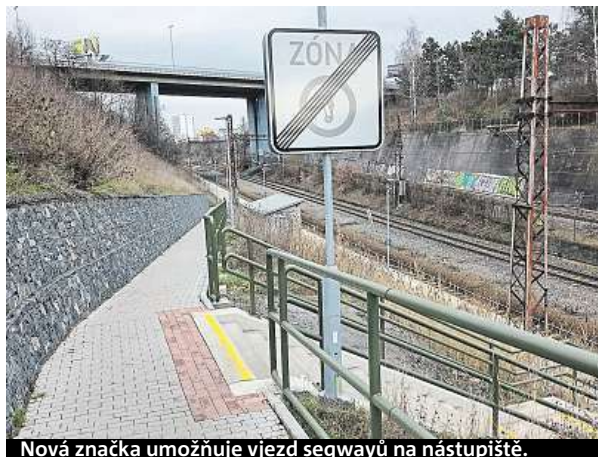
Nová značka umožňuje vjezd segwayů na nástupiště.

Značka na Kačerově není jedinou. Na podobné zákazy upozornili čtenáři i u schodů na Vyšehrad, pod schody mezi ulicemi Soběslavská a V Horní Stromce nebo v Žalmanově ulici v Braníku. ROW