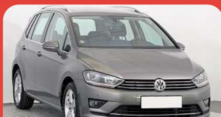
Volkswagen Golf Sportsvan 1.4...

Vyrobena: 2016 Najeto: 15 502 km Palivo: benzín Cena: 480 000 Kč