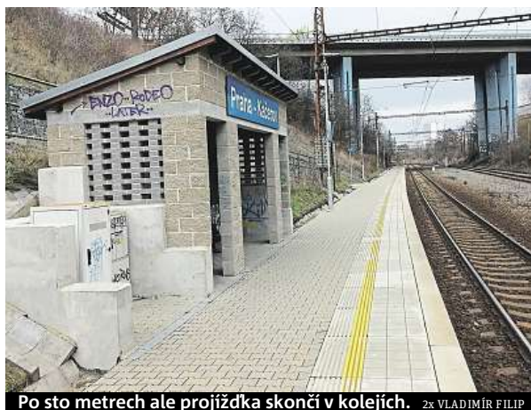
Po sto metrech ale projíždku skončí v kolejích.