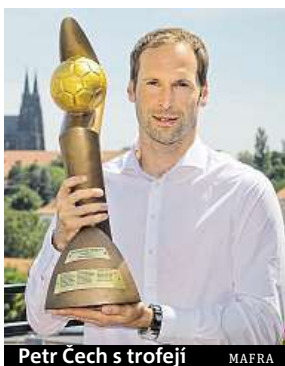
Petr Čech s trofejí

Čtyřiatřicetiletý Čech sice v létě po mistrovství Evropy ukončil reprezentační kariéru, i tak se nadále pohyboval na předních místech většiny hlasovacích lístků. Jako jediný český fotbalista nastupuje za přední evropský klub. S Arsenalem je nyní na druhé příčce anglické ligy o tři body za Chelsea a s 15 inkasovanými góly v 15 zápasech má třetí nejlepší bilanci v soutěži.