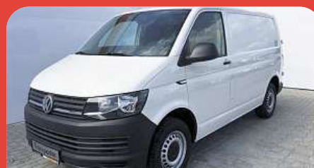
Volkswagen Transporter 2,0TDI...

LB Automobile - Autocentrum Praha 241 711 643 722 660 672 | www.lbautomobile.cz