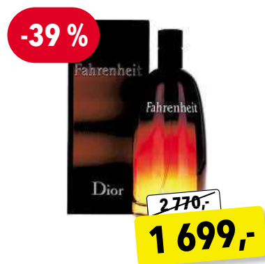
CHRISTIAN DIOR Fahrenheit EdT 100 ml

Cena v Douglas 2 619,- Cena v Sephora 2 620,-