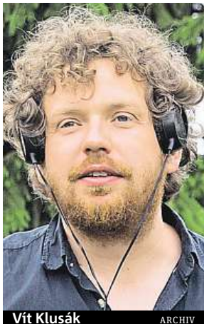
Vít Klusák ARCHIV

Tihle malí zakuklení fašounci se staví do pozice novodobých disidentů, proto to připodobňování ke Karlu Krylovi, který ve své době také přechal za svobodu. Nejen proto bych je hnal klackem. Je potřeba bez okolků zdůraznit, že kapela Ortel je náckovská: vznikla z nepokryté neonacistické kapely Konflikt 88 (číslo značí Heil Hitler), její frontman pan Hnídek se s plzeňskými nácky doložitelně kámoší a fotí, jejich publikum se hemží holými lebkami a tričky, která si