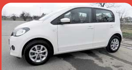
Škoda Citigo 1.0MPI / 55kW...

AAA Auto International a.s. 800 400 453 | www.aaaauto.cz