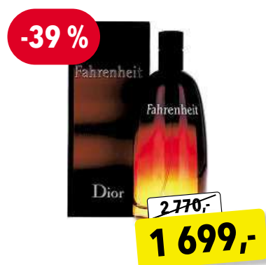
CHRISTIAN DIOR Fahrenheit EdT 100 ml

Cena v Douglas 2 619,- Cena v Sephora 2 620,-