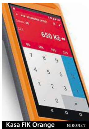
Kasa FIK Orange

Ať už je váš názor na EET jakýkoli, jedno je jisté – nevyhneme se jí, a pokud podnikáte, je potřeba se na ni připravit. První vlna podnikatelů (v ubytovacích a stravovacích službách) na systém přešla již začátkem prosince, další se budou postupně připojovat