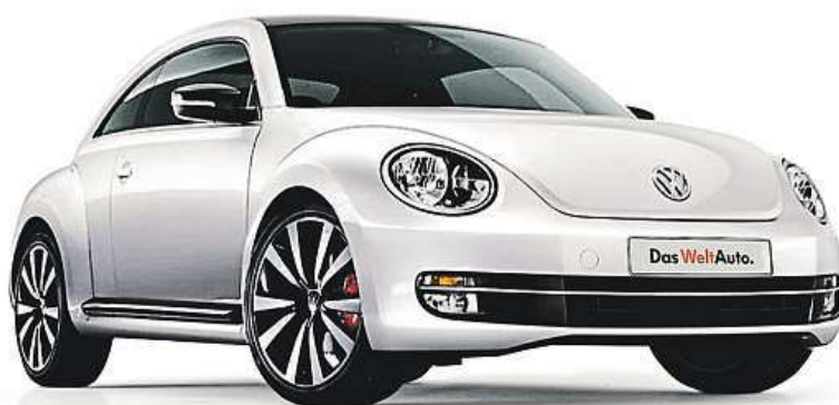
Das WeltAuto vám poskytne mnoho lákavých výhod.

V nabídce padesáti prodejních míst značky Das WeltAuto je v současnosti více než čtyři tisíce vozů nejen koncernových značek. Zákazník se může těšit z nadstandardní nabídky vozidel, ale i z profesionálních služeb, které jsou