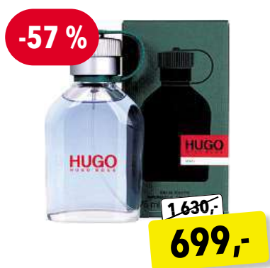
HUGO BOSS Hugo EdT 75 ml

Cena v Douglas 3 959,- Cena v Sephora 3 930,-