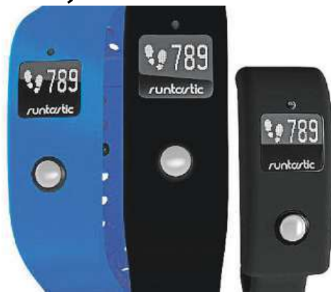
Chytrý náramek Runtastic Orbit

Obě fitness zařízení jsou vodotěsná až do hloubky 100 metrů a mají doplňkové funkce (budíků a vibrace). Samozřejmě je dlouhá výdrž baterie (náramek až týden, hodinky až 6 měsíců) a příkladná spolupráce s mobilní aplikací Runtastic Me, kterou si můžete stáhnout zdarma i v češtině.