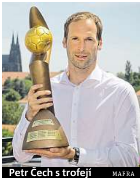
Petr Čech s trofejí

Čtyřiatřicetiletý Čech sice v létě po mistrovství Evropy ukončil reprezentační kariéru, i tak se nadále pohyboval na předních místech většiny hlasovacích lístků. Jako jediný český fotbalista nastupuje za přední evropský klub. S Arsenalem je nyní na druhé příčce anglické ligy o tři body za Chelsea a s 15 inkasovanými góly v 15 zápasech má třetí nejlepší bilanci v soutěži.