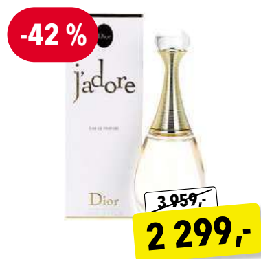
CHRISTIAN DIOR J'adore EdP 100 ml

Cena v Douglas 2 549,- Cena v Sephora 2 550,-