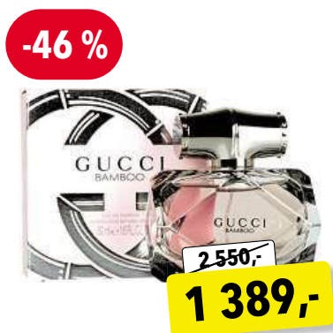
GUCCI Bamboo EdP 50 ml

Cena v Douglas 2 699,- Cena v Sephora 2 690,-