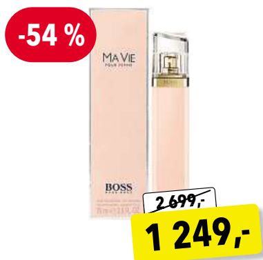
HUGO BOSS Ma Vie EdP 75 ml

Cena v Douglas 2 699,- Cena v Sephora 2 690,-