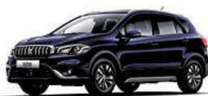
Suzuki SX4 S-Cross