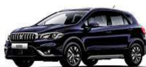
Suzuki SX4 S-Cross