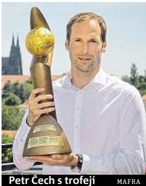
Petr Čech s trofejí

Čtyřiatřicetiletý Čech sice v létě po mistrovství Evropy ukončil reprezentační kariéru, i tak se nadále pohyboval na předních místech většiny hlasovacích lístků. Jako jediný český fotbalista nastupuje za přední evropský klub. S Arsenalem je nyní na druhé příčce anglické ligy o tři body za Chelsea a s 15 inkasovanými góly v 15 zápasech má třetí nejlepší bilanci v soutěži.