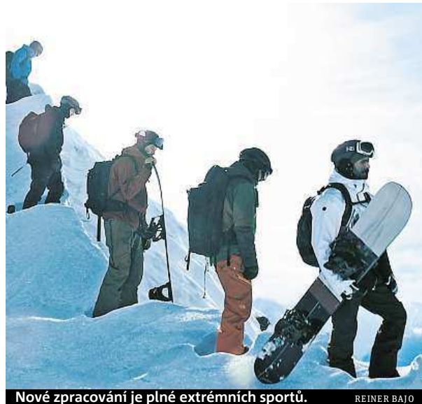
Nové zpracování je plné extrémních sportů.

Bod zlomu je film plný odvažných kaskadérských kousků. Před kamerou si na ně troufli skuteční elitní sportovci, kteří jsou absolutní světovou špičkou v takových odvětvích jako je surfování na obřích vlnách, létání