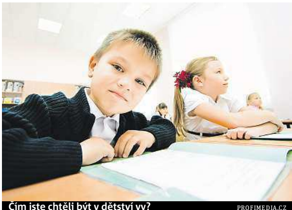
Čím jste chtěli být v dětství vy?

Nejoblíbenějšími předměty jsou mezi dětmi tělocvik, angličtina, matematika či informatika, přičemž nejvýznamnější vliv na oblíbenost předmětu má učitel. Vyplývá to z výsledků Minisčítání pořádaného Českým statistickým úřadem na 614 základních školách v Česku. Ukázalo se také, že pouze tři procenta dětí nevlastní mobil. Minisčítání ukázalo, že mezi pět povolání, o kterých děti do budoucna nejčastěji uvažují, patří veterinář, učitel, kuchař, policista nebo doktor. Část dětí by se rovněž chtěla stát