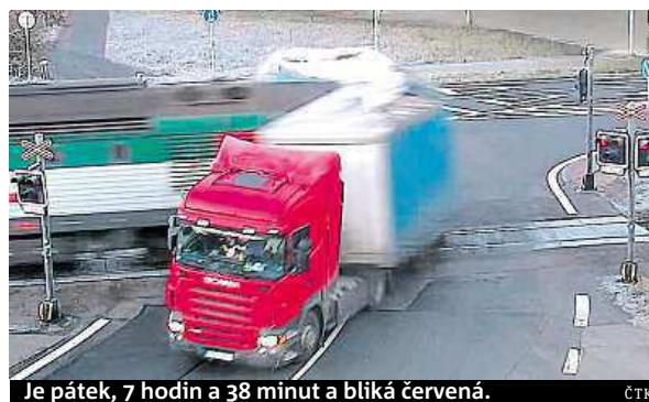
Je pátek, 7 hodin a 38 minut a blíká červená.

Je to jedno z nejsledovanějších videí z konce minulého týdne na českém internetu: řidič polského kamionu, který se v pátek ráno ve Frydku-Místku srazil s osobním vlakem. Po včerejšku je přitom jasné, že šofér, který přiznal chybu, do vazby nepůjde, i když mu hrozí až pětiletý trest. Zdroj blízký vyšetřování nehody totiž potvrdil, že o tom rozhodl místní okresní soud. Co se vlastně stalo? Polák na přejezd vjel na červe-