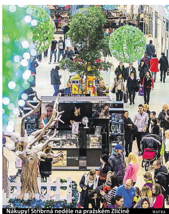
Nákupy! Stříbrná neděle na pražském Zličíně