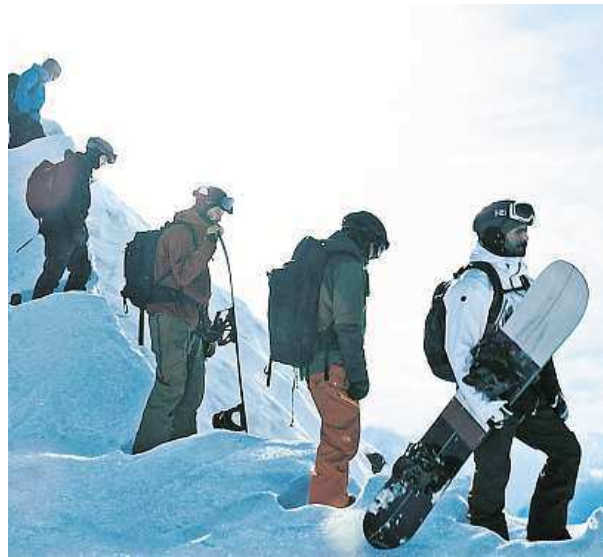
Nové zpracování je plné extrémních sportů.

Bod zlomu je film plný odvažných kaskadérských kousků. Před kamerou si na ně troufli skuteční elitní sportovci, kteří jsou absolutní světovou špičkou v takových odvětvích jako je surfování na obřích vlnách, létání