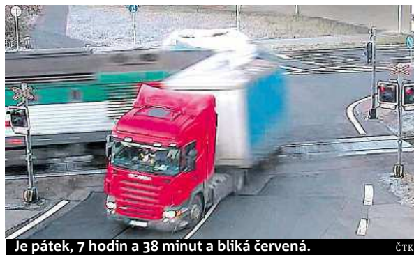
Je pátek, 7 hodin a 38 minut a blíká červená.

Je to jedno z nejsledovanějších videí z konce minulého týdne na českém internetu: řidič polského kamionu, který se v pátek ráno ve Frydku-Místku srazil s osobním vlakem. Po včerejšku je přitom jasné, že šofér, který přiznal chybu, do vazby nepůjde, i když mu hrozí až pětiletý trest. Zdroj blízký vyšetřování nehody totiž potvrdil, že o tom rozhodl místní okresní soud. Co se vlastně stalo? Polák na přejezd vjel na červe-