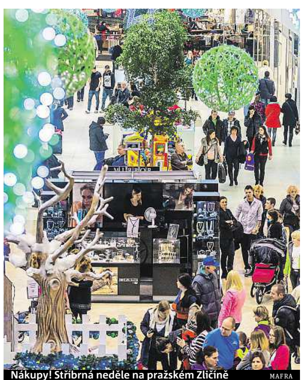
Nákupy! Stříbrná neděle na pražském Zličíně