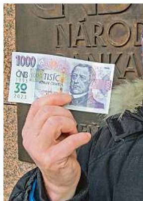
Jak zdanit peníze, které jste našli na ulici? MAFRA

V případě nálezů větší částky by se zatajení už rovnalo krádeži. Poctivcům nahrává skutečnost, že mají například nárok na nálezné, stejně jako ten, kdo najde středověký po-