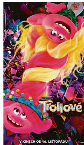
Trollové 3 jdou do kin již tento čtvrtek. Vyrazíte? 2x CINEMART

Za úspěšnými filmovými trilogiemi Shrek, Jak vycvičit draka, Kung Fu Panda a nově i Trollové stojí americké animační studio DreamWorks. Tahle dceřiná společnost studia Universal Pictures zaměřující se na animovanou tvorbu byla v roce 1994 založena mimo jiné i režisérem Stevenem Spielbergem. V současnosti firma stojí za produkcí animovaných celovečerních filmů, televizních pořadů a her ve virtuální realitě. Od