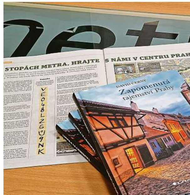
Moc nás to bavilo. Nejčastější slova chvály od našich čtenářů. Moc děkujeme. Další hry vám chystáme. Třem vylosovaným posíláme knihu o tajemstvích Prahy, kterou nedávno vydala Grada.