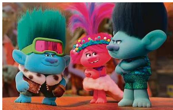
Barevný animák s písničkami a hlasy Anny Kendrick a Justina Timberlakea vydělal dost na to, aby si vysloužil dvojku a trojku.

Jednoho z nich však jeho cesta dovedla až do zajetí dvou všehoschopných popových grázlů, kteří přišli na to, jak z něj po kapkách odčerpávat jeho pěvecký talent a využít ho k tomu, aby oni sami ovládali hitparády a davy fa-