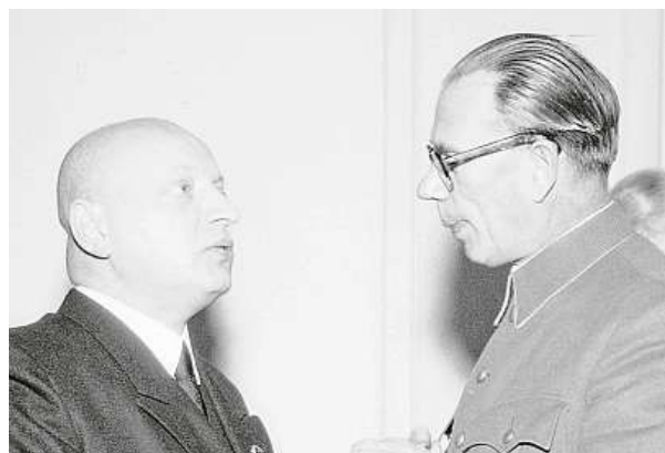
Generál Vlasov v družné debatě s Emanuelem Moravcem, protektorátním ministrem školství a národní osvěty

Proč Andrej A. Vlasov obrátil o 180 stupňů a přestupem na německou stranu bezprecedentně zradil, se vedou nekonečné spekulace. Muž, který přežil stalinské čistky v letech 1936 až 1938 a dokonce během nich předvedl vojenskému soudu, měl Stalinovu nadstandardní důvěru, dokonce jím byl v roce 1939 osobně vyslán jako vojenský poradce do Číny. Někteří, především ruští, historici nachází příčinu zrady ve Vlasovově počínající schizofrenii, jiní se přikláníjí k prostému pragmatismu podpořenému tím, že Vlasov v Sovětském svazu neměl rodinu, která by jeho velezradu odsákala.