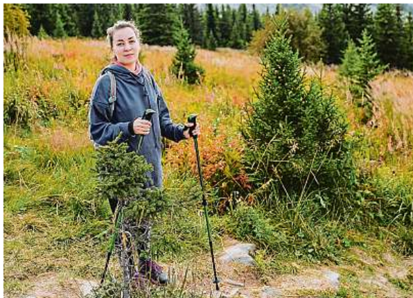
V úspěšném boji s diabetem je důležitý pravidelný pohyb.

Diabetici mají až třikrát vyšší pravděpodobnost vzniku kardiovaskulárních onemocnění, až desetkrát častěji jim selhávají ledviny a v rozvinutých zemích je cukrovka nejčastější příčinou slepoty dospělých. Stejně je to s amputacemi dolních končetin – podle IDF přijde každých 30 sekund na světě někdo o nohu (či její část) v důsled-