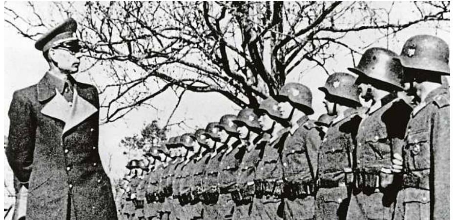
Generál Vlasov a příslušníci Ruské osvobozené armády v uniformě nacistického wehrmachtu, ke konci druhé světové války