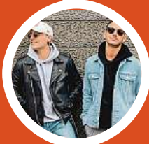
ATMO music v Lucerně oslaví 10 let 27. listopadu.