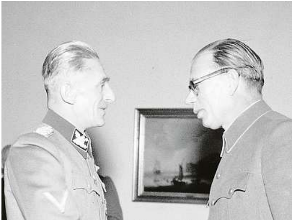
Rudolfova galerie Pražského hradu, A. Vlasov (vpravo) s K. H. Frankem, německým státním ministrem pro protektorát Čechy a Morava