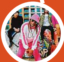
Ragga-metalová skupina Skindred do české metropole dorazí 1. prosince.