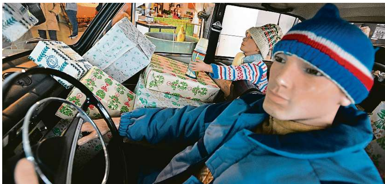
Retro zima za socíku, tak se jmenuje výstava, která je ode dneška k vidění v pražské Galerii Tančící dům.

Třaskavá kauza. Premiérův syn byl prý kvůli Čapímu hnízdu odklizen na Krym. 92 hlasů. Šest opozičních stran chce hlasovat o nedůvěře vládě. Křehká koalice. Také ČSSD bude dnes chtít od Babiše vysvětlení STRANA 3