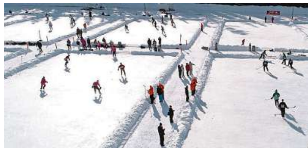
MS v rybníkovém hokeji se hraje v New Brunswicku.

Tento sport se podobá běžnému hokeji. Má ale svá specifická pravidla. Branka je asi půl metru vysoká a na šířku stejná jako hokejová. Hraje se se čtyřmi hráči v poli a bez