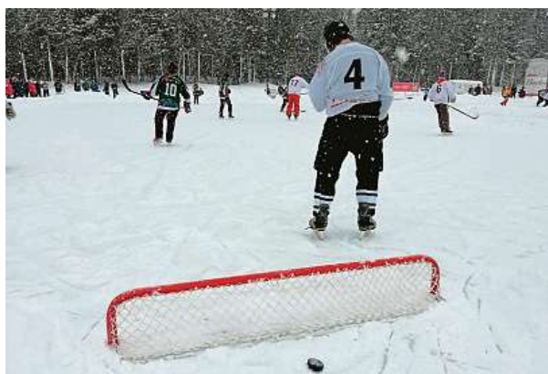
Hraje se na nízké branky bez brankáře.