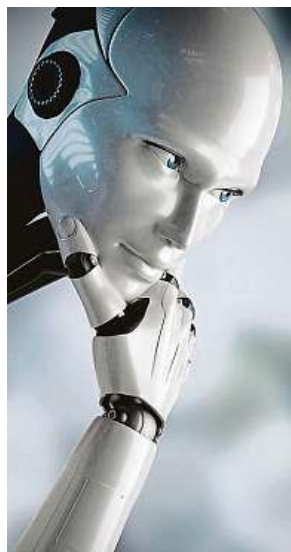
Čeká na telefon.