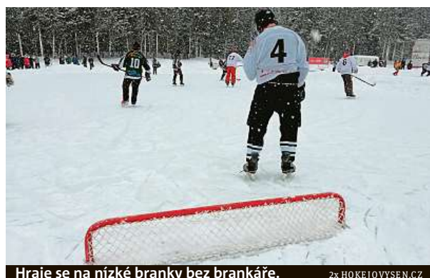
Hraje se na nízké branky bez brankáře.