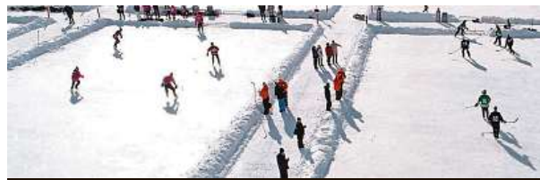
MS v rybníkovém hokeji se hraje v New Brunswicku.

První cena je placená cesta na zámořský šampionát.