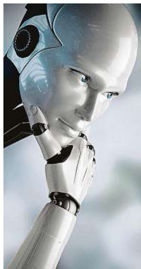
Čeká na telefon.