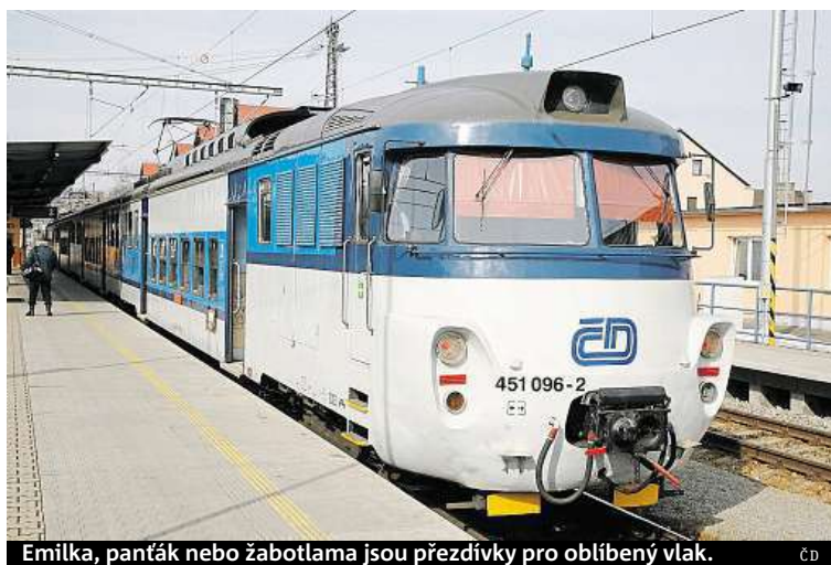
Emilka, panták nebo žabotlama jsou přezdívky pro oblíbený vlak. ČD