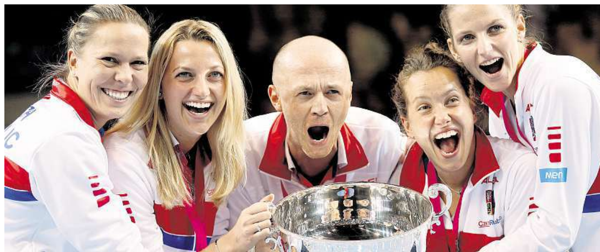
Ceské tenistky vyhrály potřeť za sebou Fed Cup. Nad Francií ve Strasburku zvítězily 3:2, rozhodla až čtyřhra. Více strana 17 AP

Světový den diabetu. Dnešek má upozornit na nemoc, kterou u nás trpí téměř milion lidí. Hrozba. Počet nemocných cukrovkou od roku 2007 narostl o 15 %. Pojišťovny. Nepokryjí celou nákladnou léčbu STRANA 8