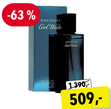
Davidoff Cool Water Man EdT 75 ml

Cena v Douglas 3 929,- Cena v Sephora 3 780,-