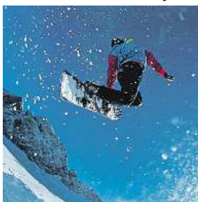
Trénujte skoky. AUSTRIA.INFO

S instruktory se tu můžete naučit nové freestylové triky. Vyzkoušet si můžete bez obav salta, na která jste si za-