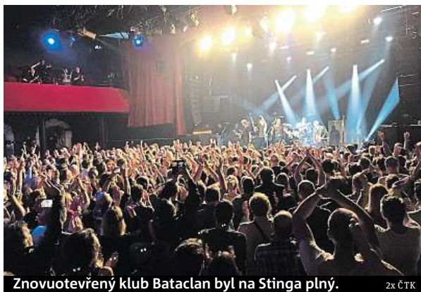
Znovuotevřený klub Bataclan byl na Stinga plný.