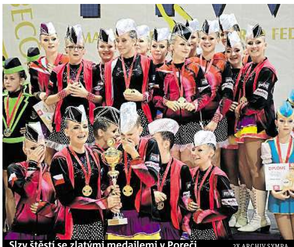
Slzy štěstí se zlatými medailemi v Poreči

Asociace mažoretetek mají své vrcholové soutěže až po mistra republiky nebo mistra světa. „Bodují se tři základní kritéria: choreografie, pohybová technika a práce s hůlkou.