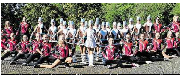
Twirling je kombinace hůlky, tance, baletu a gymnastiky.

Porotci hodnotí, jak je choreografie postavená, jestli využijí celý 12metrový prostor a jestli se pohybují po prostoru správně, jak by chtěli,“ vysvětluje Přenosilová.