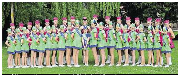
Hůlka stojí 1400 Kč. Vyrzčí třeba i šest let.