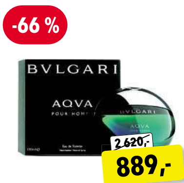
BVLGARI Aqva pour Homme EdT 100 ml

Cena v Douglas 1 390,- Cena v Sephora 1 250,-