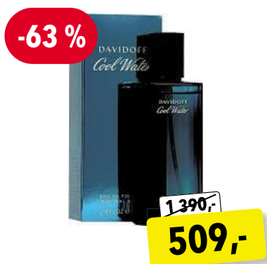
Davidoff Cool Water Man EdT 75 ml

Cena v Douglas 3 929,- Cena v Sephora 3 780,-