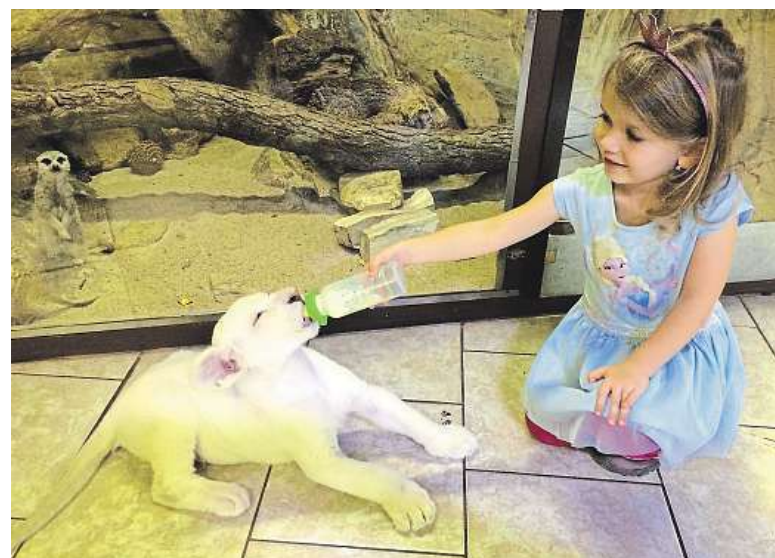
George dovádí jako každé mládě.