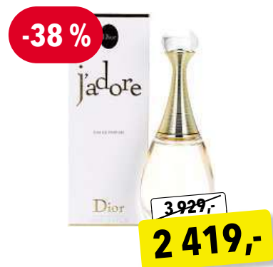
CHRISTIAN DIOR J'adore EdP 100 ml

Cena v Douglas 1 500,- Cena v Sephora 2 350,-