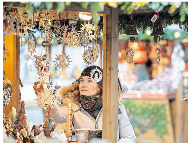
Většina trhů začíná během listopadu.

V Berlíně pořádají dokonce 60 adventních trhů a většina začíná už 21. listopadu. Zadevát si můžete na sáňkařské dráze s výhledem na Braniborskou bránu, využít venkovní kluziště, curling a ochutnat vánoční pochout-