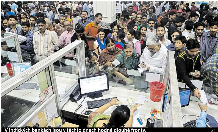
V indických bankách jsou v těchto dnech hodně dlouhé fronty.

„Zuřím, protože vláda opomínula naplánovat další postup, když podnikla tak obrov-