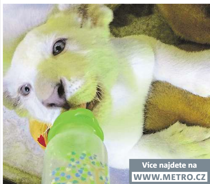
Péče o lvíče

Přes den je George v ZOO Terárium v Dubči. „Pro mě je to jako odložení děcka do školky. Během té doby se snažím stihnout svoji práci v zaměstnání a nakoupit. Odpoledne ho vyzvednu a už jedeme rovnou domů,“ vysvětluje