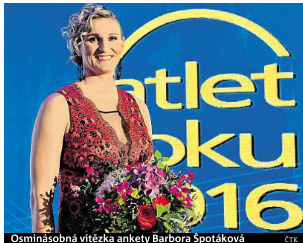
Osmínásobná vítězka ankety Barbo- ra Špotáková

Světovou rekordmanka Špotáková je jedinou letošní českou atletickou olympijskou