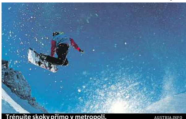
Trénujte skoky přímo v metropoli.