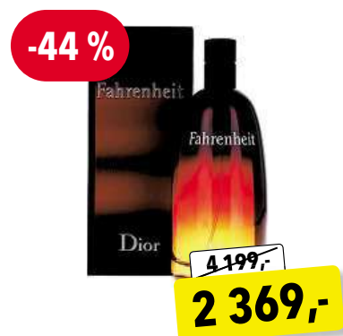
CHRISTIAN DIOR Fahrenheit EdT 200 ml

Cena v Douglas 2 619,- Cena v Sephora 2 620,-