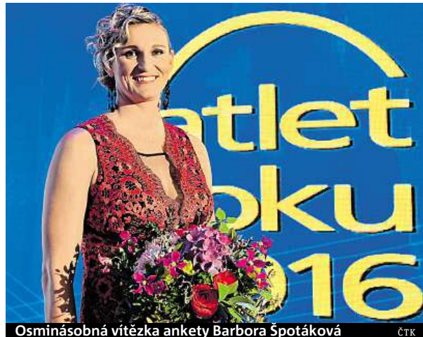
Osmínásobná vítězka ankety Barbora Špotáková

Světová rekordmanka Špotáková je jedinou letošní českou atletickou olympijskou