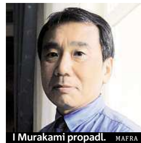
I Murakami propadl.

pasáž: „Políbil tenkou, narůžovělou rýhu od pruženky jejích kalhotek, která obkružovala její břicho tak jako čára rovníku Zemi. Jak se pohroužili do vzájemného obeplouvání, pro-