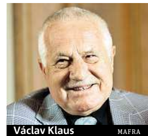
Václav Klaus

Výročí sametové revoluce si připomenou lidé v ulicích, ale i ekonomové a politici na konferenci s tématem 25 let kapitalismu v České republice. Koná se zítra na Zofíně po celý den a zajímavým vrcholem bude duel prezidentů Zemana a Klause.