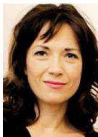
Tereza Kostková, herečka a moderátorka

kteřé se já těším každý den. Když vezmu život mých prarodičů a porovnáám ho s mým životem, tak mám tolik nezaslouženého štěstí, že se z toho musím radovat každý den. Nemám radost z toho, co se děje, ne, že bych byl vždycky spokojen s naší politickou reprezentací, ale přes to všechno, je to, že jsme dostali svobodu, dar, kterého je potřeba si vážit.