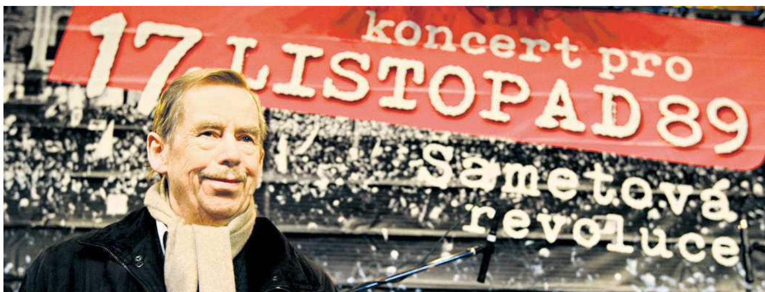
Dramatik a bývalý prezident Václav Havel je i po své smrti v prosinci roku 2011 stále symbolem sametové revoluce. Před pěti lety slavil její 20. výročí.

17. listopad 1989. V pondělí slavíme svátek, který připomíná sametovou revoluci. Národní třída. Zde se koná jedna z připomínek pádu totalitního režimu. Proti Zemanovi. Konají se také antiakce STRANY 2 AŽ 8