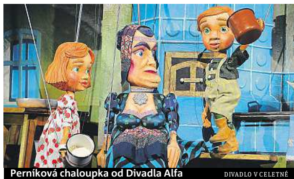
Perníková chaloupka od Divadla Alfa DIVADLO V CELETNÉ

Každý listopadový víkend je v Divadle v Celetné vyhrazen loutkám a dětem.