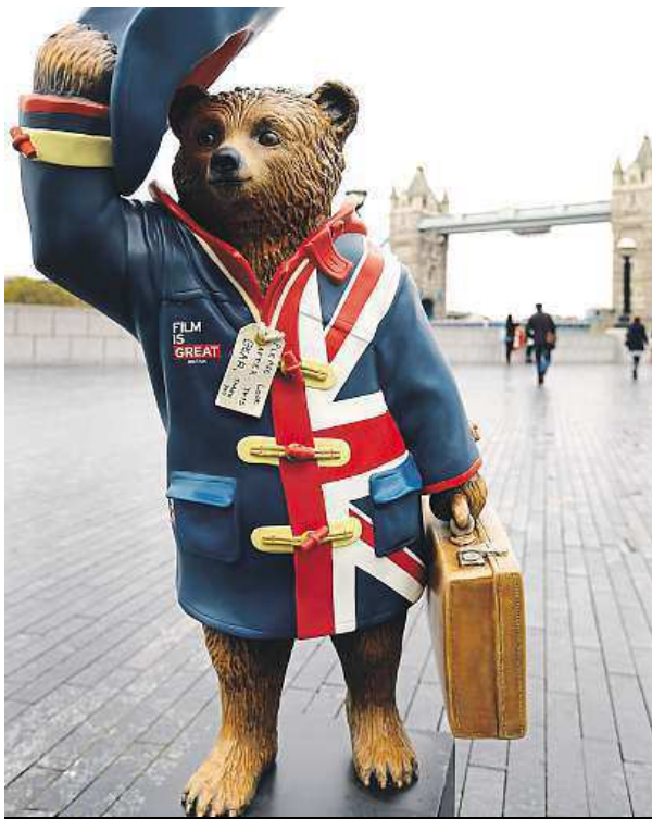
Sochu medvídká teď najdete i u Tower Bridge v Londýně.