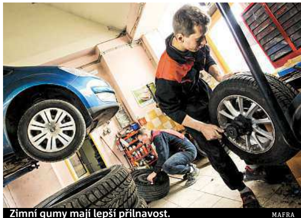
Zimní gummy mají lepší přilnavost.

Vyplatí se investovat do vosků, které lak ochrání. Nanášejí se tak vrstva, která zabráňuje menšímu poškrábání. Existují také speciální zimní přípravky pro ošetření litých kol pro ty, kdo na nich mají nazuté zimní pneumatiky. Je ale ještě jeden důležitější dů-