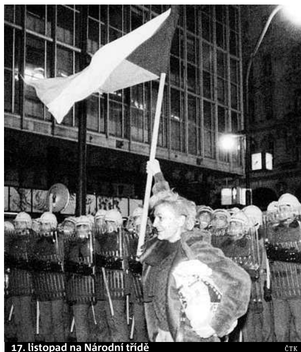
17. listopad na Národní třídě

• Nezávislá lékařská komise později uvedla, že bylo během policejního zásahu zraněno 568 lidí.