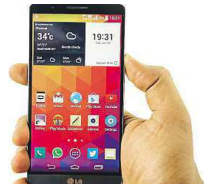
G3 je sice levnější, neznamená to však, že horší. MIRONET

Kdepak, jenom cenová politika jeho výrobce je příjemnější a zajímavější. G3 je totiž špičkový smartphone s nejlepším poměrem ceny a výkonu. Jeho displej je dominantnější než u jiných smartphonů a jeho rozlišení 2560 x 1440 pixelů deklaruje rozšířenější full HD. Je to patrný rozdíl? Při přímém porovnání