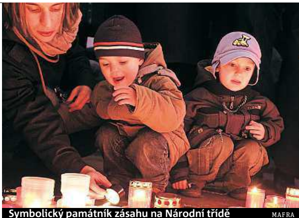
Symbolický památník zásahu na Národní třídě

Křižovnické nám. – Karlův most – Mostecká – Malostranské nám. – Zámecké schody – Hradčanské nám. 14.30 – 21.00, Demonstrace a diskuse