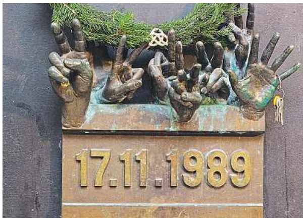
Plastika v podloubí domu připomíná 17. listopad 1989. MAPRA

Na Mezinárodní den studentstva se Národní třída změní v živý prostor, místo plné umění a lidí. Svě díky přijdou projevit profesioná-