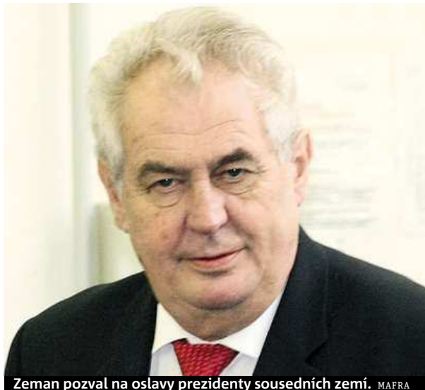
Zeman pozval na oslavy prezidenty sousedních zemí.

Další účastníci připomínky výročí 17. listopadu se svolávají na sociálních sítích. Mezi největší patří iniciativa nazvaná Chci si s vámi promluvit, pane prezidente, ke které se na Facebooku hlásí více než 14 tisíc lidí. Chtějí vyjádřit neshlas s tím, jak prezident občany zastupuje. Slibují klidný protest, který je řádně ohlášen na pražském magis-