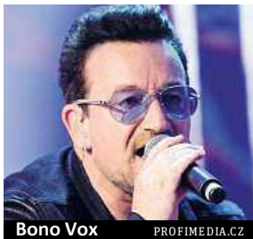
Bono Vox

Mluvíci letiště Schönefeld Ralf Kunkel včera ubezpečil, že ztráta vyklápěcích dveří o rozměrech 80 krát 100 centimetrů pád letadla způsobit