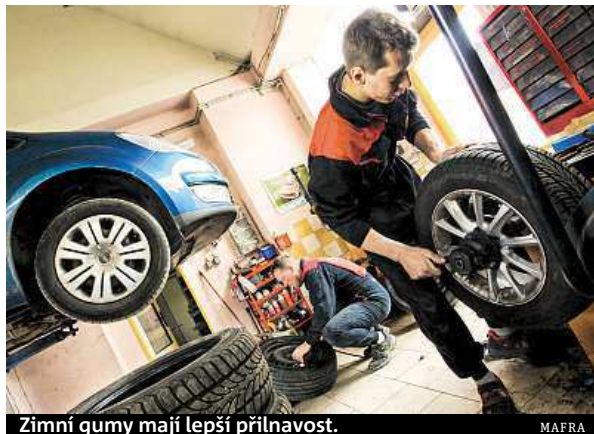
Zimní gumy mají lepší přilnavost.

Zimní pneumatiky, škrabka na skla, speciální vosk a nemrzoucí směsi. To je zimní výbava pro vaše auto.