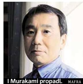
I Murakami propadl.

pasáž: „Políbil tenkou, narůžovělou rýhu od pruženky jejích kalhotek, která obkružovala její břicho tak jako čára rovníku Zemi. Jak se pohroužili do vzájemného obeplouvání, pro-