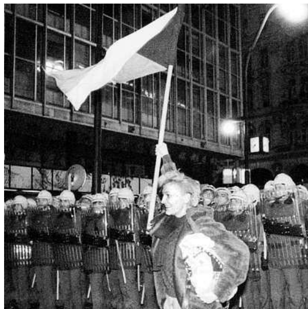
17. listopad na Národní třídě