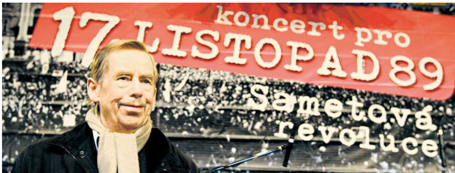
Dramatik a bývalý prezident Václav Havel je i po své smrti v prosinci roku 2011 stále symbolem sametové revoluce. Před pěti lety slavil její 20. výročí.

17. listopad 1989. V pondělí slavíme svátek, který připomíná sametovou revoluci. Národní třída v Praze. Zde se koná jedna z připomínek pádu totalitního režimu. Proti Zemanovi. Konají se také antiakce STRANY 6 A 7