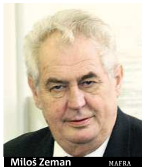
Miloš Zeman

Na pět tisíc lidí očekávají organizátoři protestního pochodu proti prezidentu Miloši Zemanovi, který vyjde v pondělí z Betlémského náměstí a přes Mánesův most zamíří na Loretské náměstí.