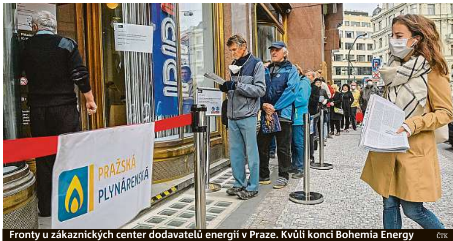
Fronty u zákaznických center dodavatelů energií v Praze. Kvůli konci Bohemia Energy ČTK