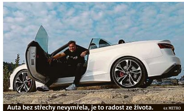
Auta bez střechy nevymřela, je to radost ze života. 4x METRO