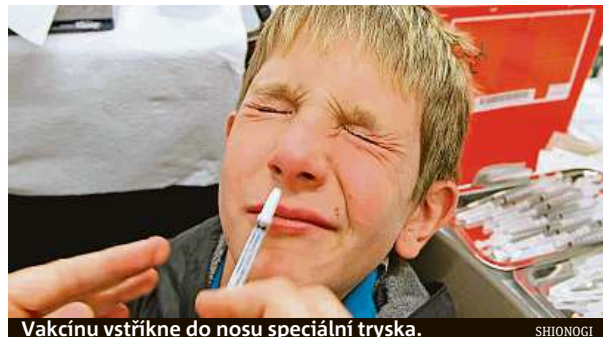
Vakcínu vstříkne do nosu speciální tryska.

Moskva zahajuje „ostrý“ test covidové vakcíny, jež má podobu nosního spreje. Je stvořena pro děti, ale i pro dospělé, kteří se bojí jehly.