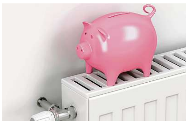
Teplo bude velkým tématem nejbližších let.

Ve světě si to, na rozdíl od Prahy, uvědomují. Evropská unie se rozhodla, že bude do roku 2050 uhlíkově neutrální. Vytvořila proto balíček Fit for 55, který předpokládá, že jakékoli zbytečné emise budou tvrdě zpoplatněny. Vytápění lokálními topeništi v místech s možností napoje-