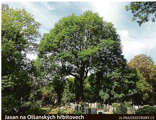
Jasan na Olšanských hřbitovech

Databázi stromů si lze prohlédnout na webu prazskestromy.cz. V interaktivní mapce, která se zde rovněž nachází, je možné také dřeviny filtrovat nejen podle městských částí, ale například i podle správních obvodů. Jejich databáze se rozšiřuje i na základě podnětů veřejnosti.