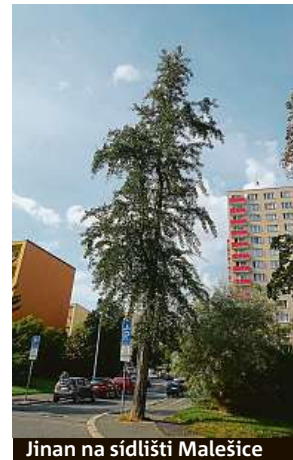
Jinan na sídlišti Malešice

Na jaře podle Rudla při mapování vypomohla také radnice Prahy 3.