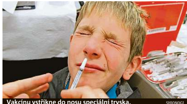
Vakcínu vstříkne do nosu speciální tryska.

Moskva zahajuje „ostrý“ test covidové vakcíny, jež má podobu nosního spreje. Je stvořena pro děti, ale i pro dospělé, kteří se bojí jehly.