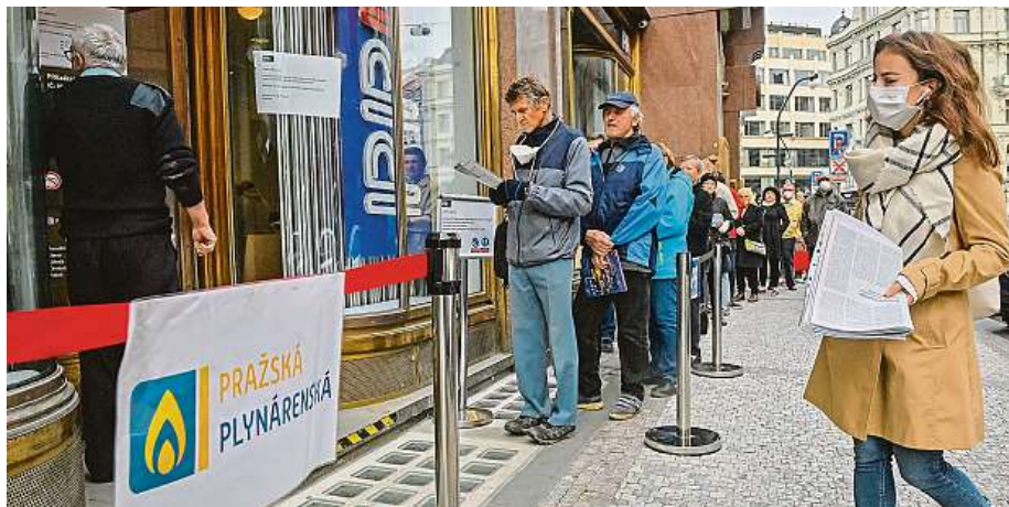
Fronty u zákaznických center dodavatelů energií v Praze. Kvůli konci Bohemia Energy