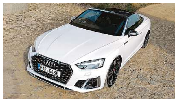
Předností tohoto kabrioletu je velmi tuhá karoserie.