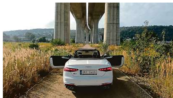
Porovnávané ladvé křivky s brutalismem mostu v Radotíně.