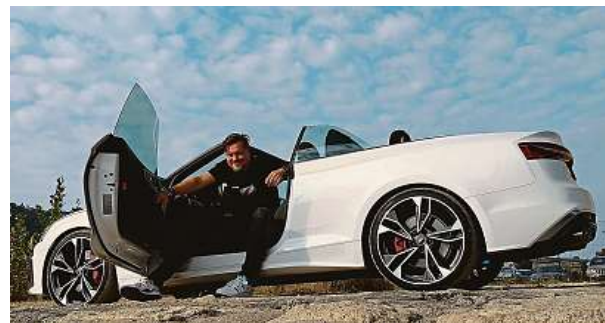
Auta bez střechy nevymřela, je to radost ze života.