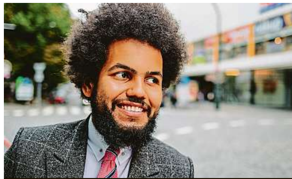
Bývalý poslanec v době před kauzou

Ke konci června přidal příspěvek s tím, že vláda rozhodla o prodloužení prominutí DPH na respirátory. Poté se