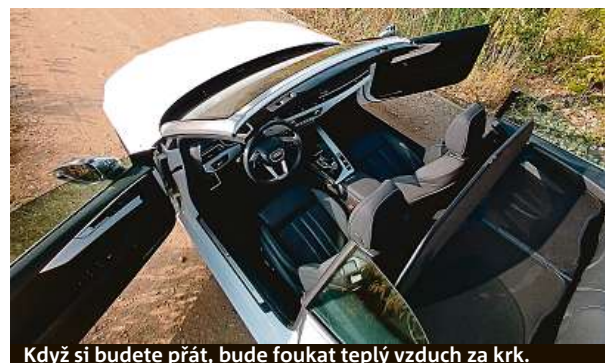
Když si budete přát, bude foukat teplý vzduch za krk.