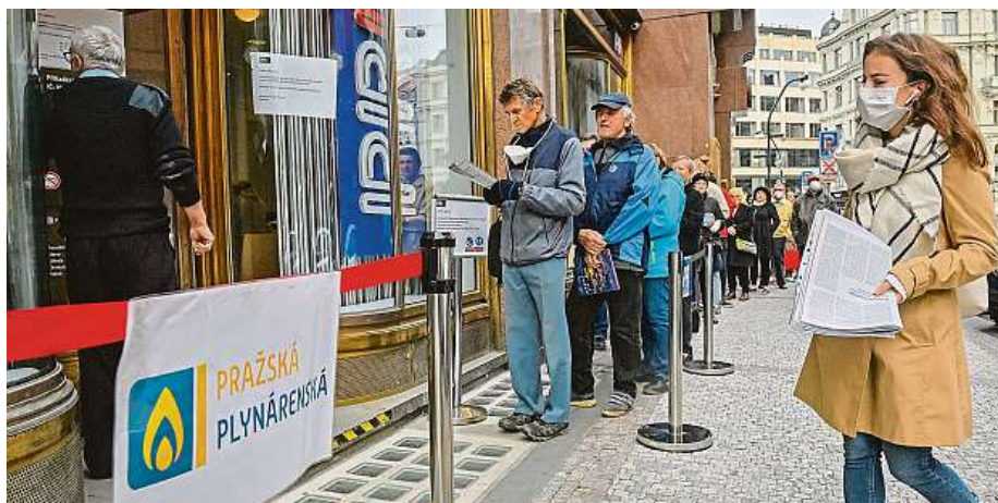
Fronty u zákaznických center dodavatelů energií v Praze. Kvůli konci Bohemia Energy