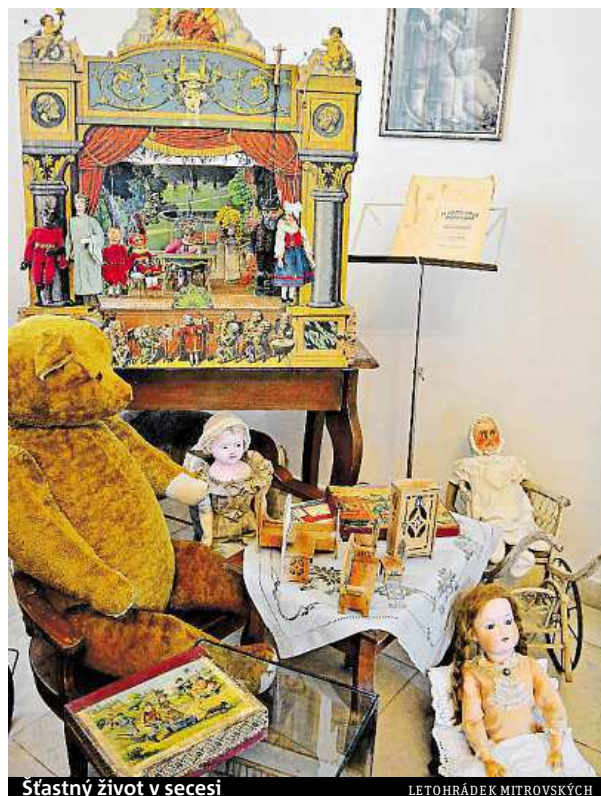
Šťastný život v secesi