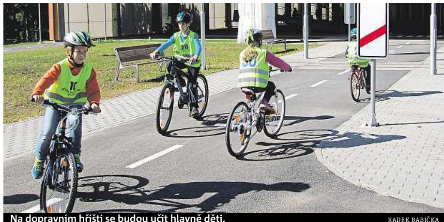
Na dopravním hřišti se budou učit hlavně děti.

Právě strážníci našli v přilehlém zrekonstruovaném zámečku zázemí a o chod areálu se nyní starají, obsluhují dopravní hřiště a vysvětlují