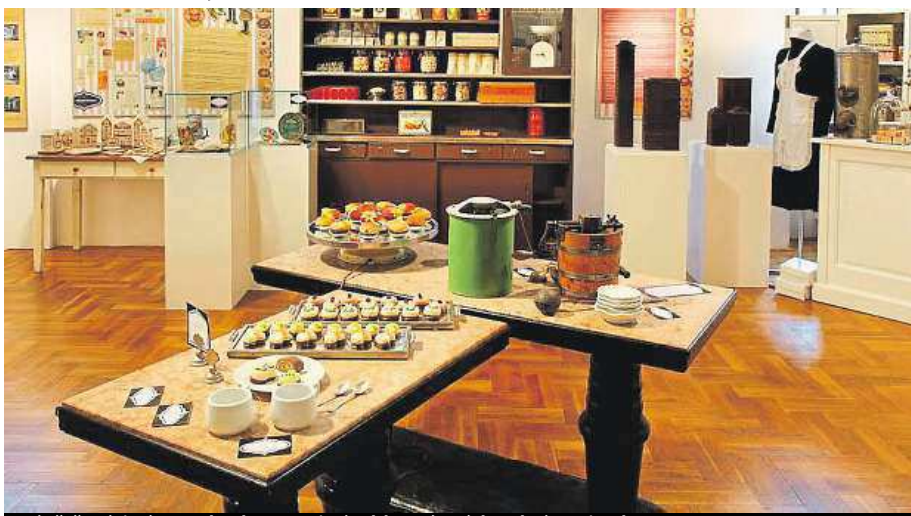
Návštěvníci výstavy budou moci výrobky místních cukráren i ochutnat.