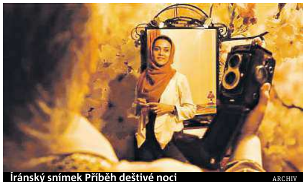
Íránský snímek Příběh deštivé noci