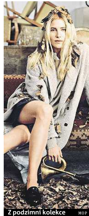
Z podzimní kolekce MOP

Rádi samozřejmě uvítáme všechny naše zákazníky. Prodejna se navíc nachází v krásných prostorech Peterkova domu. LÍDA KULLOVÁ