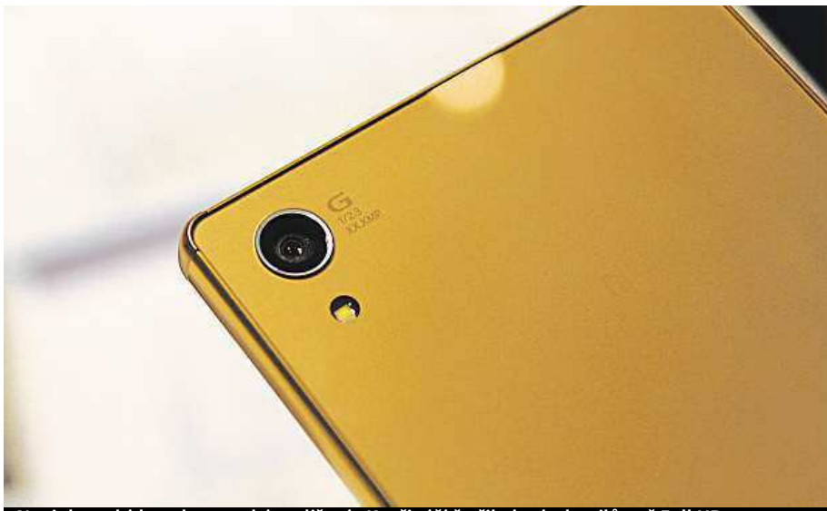
Novinka nabídne ultravysoké rozlišení 4K, přináší čtyřikrát víc detailů než Full HD. MIRONET

Zatímco první dva modely jsou již k dostání, my se blíže podíváme na model Premium. Na ten si sice budeme muset ještě pár dnů počkat, ale