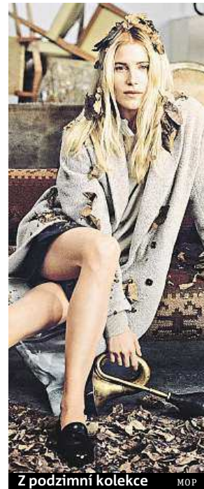
Z podzimní kolekce MOP