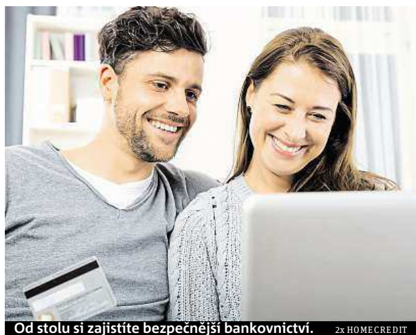
Od stolu si zajistíte bezpečnější bankovníctví. 2x HOME CREDIT

Pomohou vám hlídat denní výdaje a ochránit vaše úspory, když se karta dostane do nesprávných rukou. Limity na platební kartě si rozhodně zaslouží vaši pozornost. Každá banka má v oblasti nastavení limitů jiné možnosti, což je výhoda. Každému totiž vyhovují jiné. Než ale začnete zkoumat jednotlivé typy limitů, společnost Home Credit doporučuje odpovědět si na následující otázky: Je u vaší banky změna limitů zpłatněná? Umožňuje banka změnu limitů prostřednictvím internetového bankovníctví? Za jak dlouho se změna v nastavení limitu projeví? MET