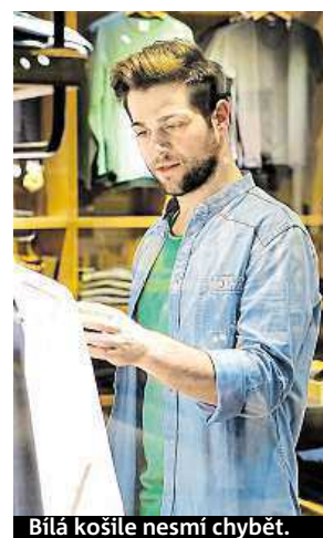
Bílá košile nesmí chybět.

Zároveň neplatí, že to nejdražší oblečení je vždy nejvyšší kvality. Často totiž platíte za značku. A přitom stejně kvalitní módní kousek mají v sousedním obchodě o polovinu levnější. A když už si nějaký kvalitní kousek vyberete, počkejte na výprodeje. Jestli nepotřebujete oblečení akutně, vydržte měsíc nebo dva. Obchody naskladní nové kolekce a těch starých se chtě-