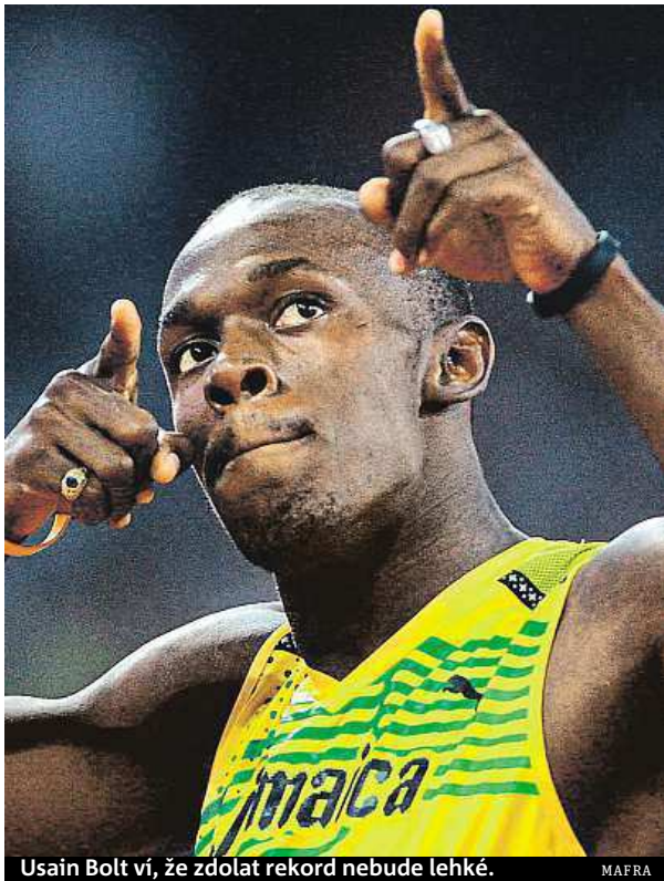
Usain Bolt ví, že zdolat rekord nebude lehké.

Ten se na olympiádě v Riu může stát prvním sprinterem, který by na olympiádě vyhrál potřeby za sebou stov-