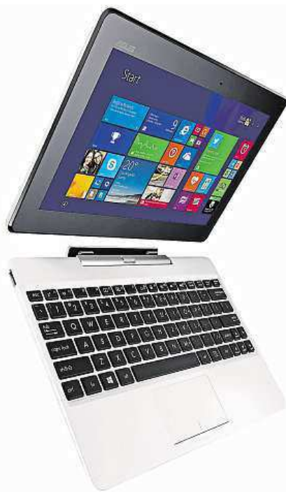
Vždy se najde řešení, může jim být i tento ASUS. MIRONET

Díky operačnímu systému Windows 8.1 dostanete do rukou, v populárním dlaždicovém rozhraní, všechny pracovní nástroje společnosti Microsoft včetně například plnohodnotné kancelářské sady Office nebo mnoha užitečných i zábavných aplikací z virtuálního obchodu Win-