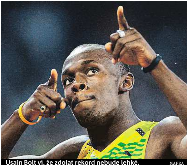
Usain Bolt ví, že zdolat rekord nebude lehké.

Jedním dechem dodal, že zároveň půjde o velmi těžký