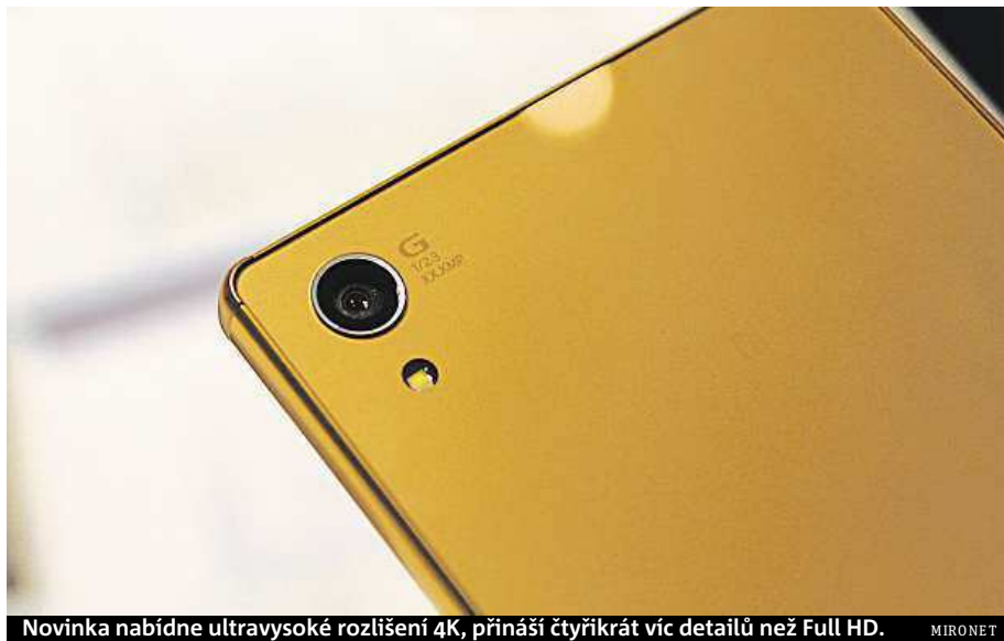
Novinka nabídne ultravysoké rozlišení 4K, přináší čtyřikrát víc detailů než Full HD.

Zatímco první dva modely jsou již k dostání, my se blíže podíváme na model Premium. Na ten si sice budeme muset ještě pár dnů počkat, ale