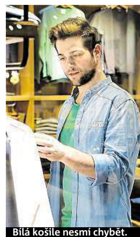
Bílá košile nesmí chybět.

Zároveň neplatí, že to nejdražší oblečení je vždy nejvyšší kvality. Často totiž platíte za značku. A přitom stejně kvalitní módní kousek mají v sousedním obchodě o polovinu levnější. A když už si nějaký kvalitní kousek vyberete, počkejte na výprodeje. Jestli nepotřebujete oblečení akutně, vydržte měsíc nebo dva. Obchody naskladní nové kolekce a těch starých se chtě-