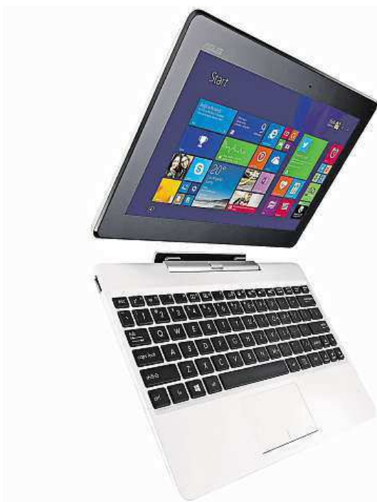
Vždy se najde řešení, může jim být i tento ASUS. MIRONET

Díky operačnímu systému Windows 8.1 dostanete do rukou, v populárním dlaždicovém rozhraní, všechny pracovní nástroje společnosti Microsoft včetně například plnohodnotné kancelářské sady Office nebo mnoha užitečných i zábavných aplikací z virtuálního obchodu Win-