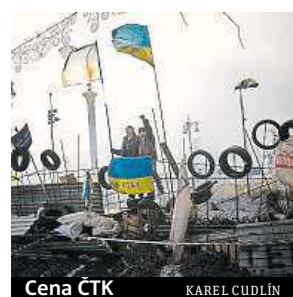
Cena ČTK KAREL CUDLÍN