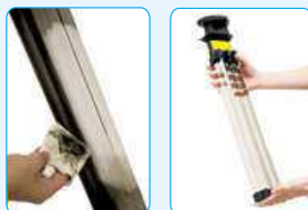
Filtry není třeba nikdy vyměňovat! Stačí je jen občas jednoduše vyjmout a otrít. Účinek filtrace ihned vidíte!