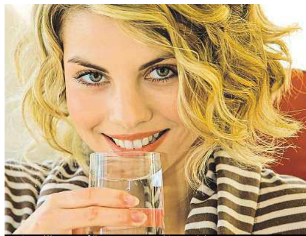
Minerálka pomůže s nespavostí i ranní únavou.

také na detoxikaci organismu. Jeho nedostatek se může projevit rychlou únavou, častou bolestí hlavy a problémy s koncentrací. Výsledkem pak