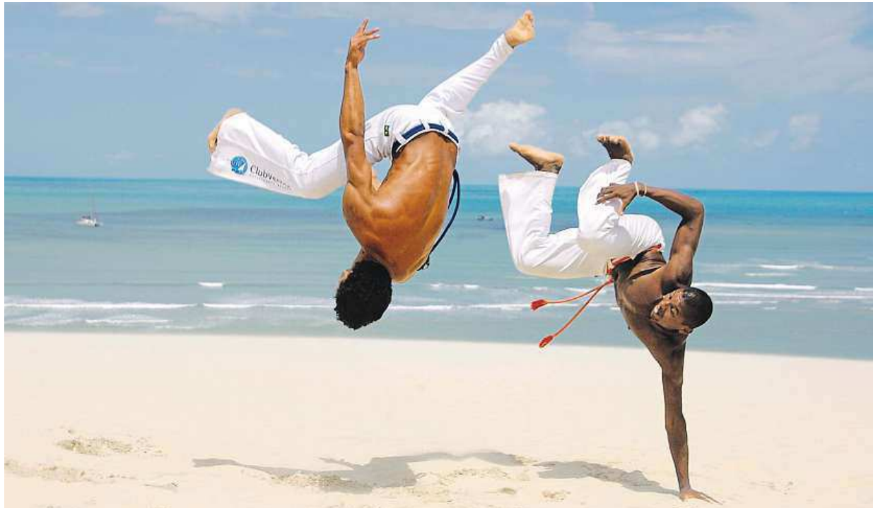
Like karate or judo, capoeira is considered a martial art.