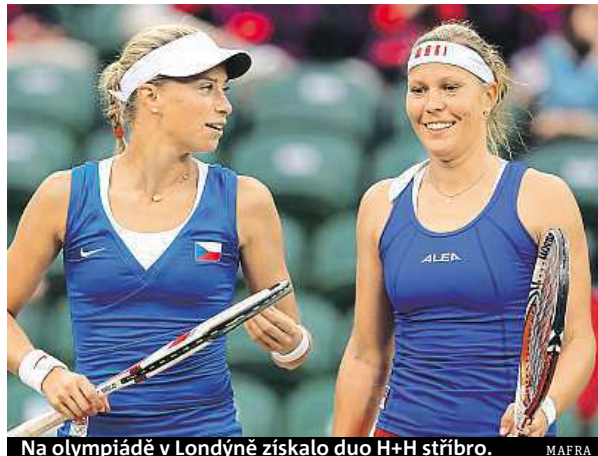
Na olympiádě v Londýně získalo duo H+H stříbro.

V tomto případě šlo o celkem očekávaný krok nehráčiho kapitána Petra Pály, stejně jako v případě nominování české jedničky Petry Kvitové a 17. hráčky světa Lucie Šafářové. S jedním překvapením ale Pála přeci jen přišel. V jeho širším výběru jsou