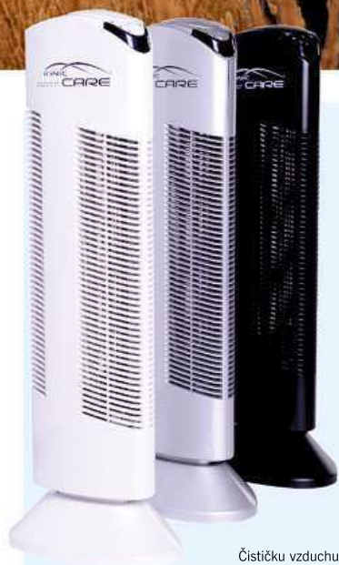
Čističku vzduchu Ionic-CARE Triton X6 můžete zakoupit ve třech barevných provedeních.