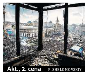
Akt., 2. cena P. SHELOMOVSKIY