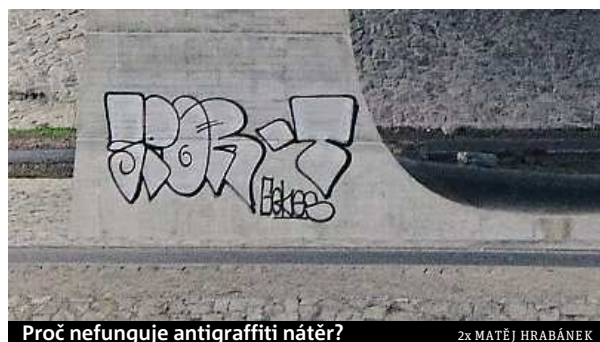
Proč nefunguje antigraffiti nátěr?