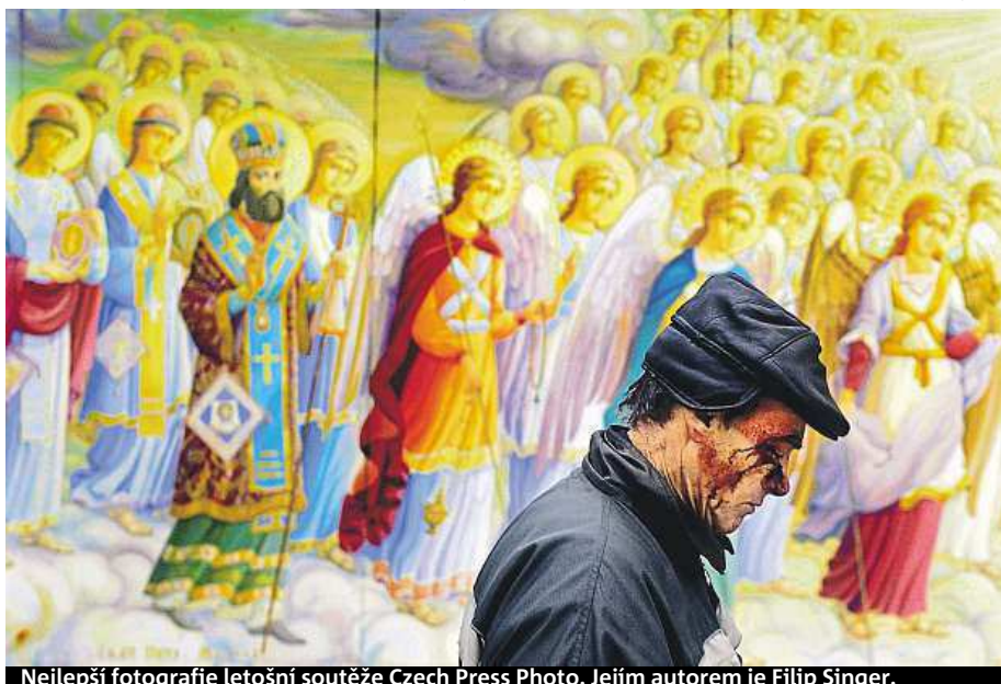
Nejlepší fotografie letošní soutěže Czech Press Photo. Jejím autorem je Filip Singer.

Vítězný snímek Filipa Singera vznikl na počátku demonstrací na kyjevském náměstí Majdan. „Fotografie roku na osudu jednotlivce zobrazuje nejvýznamnější současnou evropskou událost. Osobní bolest neznámého muže je věcí nás všech.