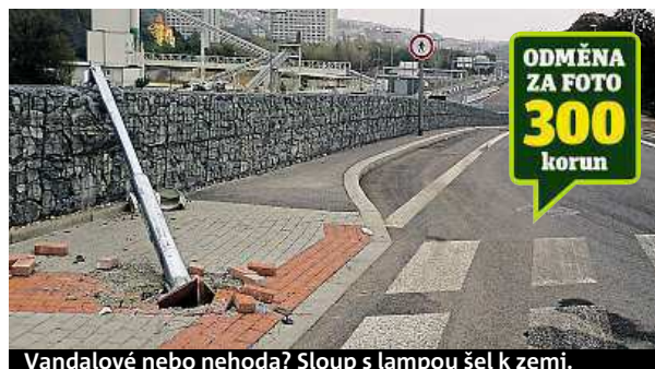
Vandalové nebo nehoda? Sloup s lampou šel k zemi.