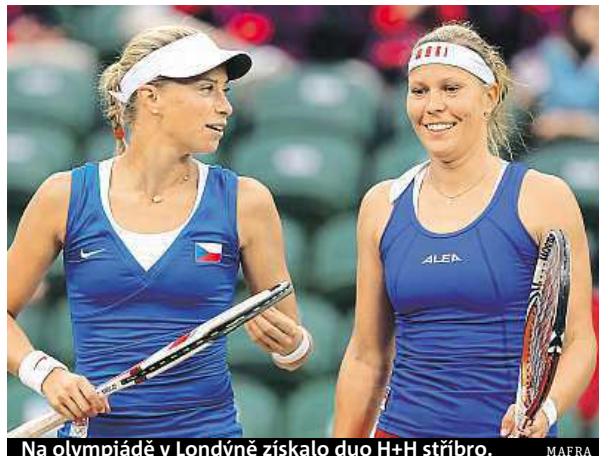
Na olympiádě v Londýně získalo duo H+H stříbro.

V tomto případě šlo o celkem očekávaný krok nehrajícího kapitána Petra Pály, stejně jako v případě nominování české jedničky Petry Kvitové a 17. hráčky světa Lucie Šafářové. S jedním překvapením ale Pála přeci jen přišel. V jeho širším výběru jsou