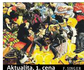
Aktualita, 1. cena F. SINGER

mezinárodní porota. Singerova série fotografií zvítězila také v kategorii Aktualita následována dvěma fotografiemi volného novináře Petra