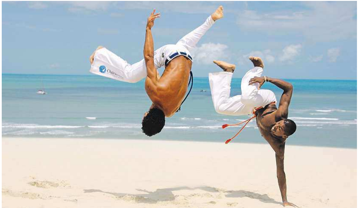
Like karate or judo, capoeira is considered a martial art.