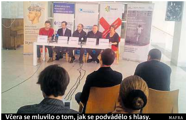
Včera se mluvilo o tom, jak se podvádělo s hlasy.