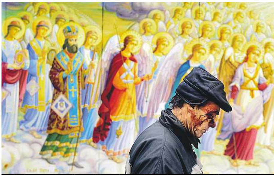
Nejlepší fotografie letošní soutěže Czech Press Photo. Jejím autorem je Filip Singer.

Vítězný snímek Filipa Singera vznikl na počátku demonstrací na kyjevském náměstí Majdan. „Fotografie roku na osudu jednotlivce zobrazuje nejvýznamnější