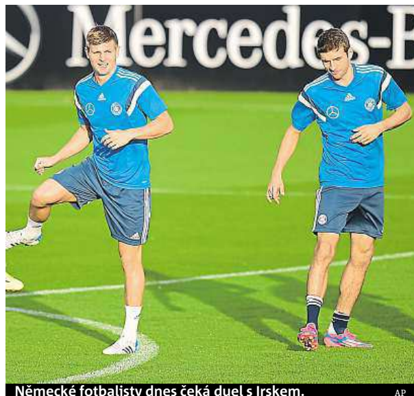
Německé fotbalisty dnes čeká duel s Irskem.