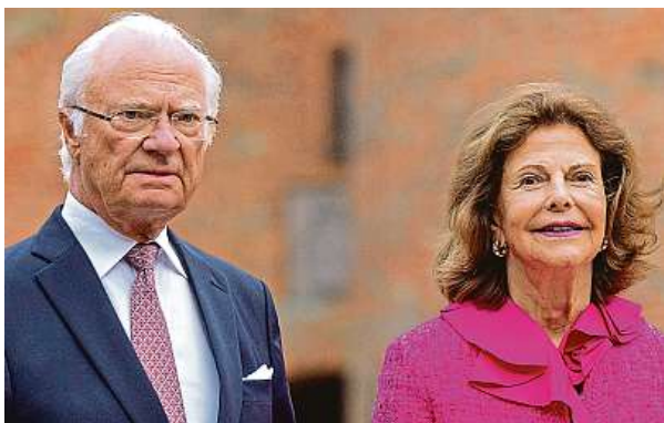
Švédský král Karel XVI. Gustaf a královna Silvie

Úctyhodné půlstoletí vlády, které zítra dovrší, řadí švédského krále Carla XVI. Gustafa na čtvrté místo v žebříčku nejdéle vládnoucích monarchů světa aktuálně u moci. A je také moderní – sám řídí auto, platí daně a jeho majetek se víceméně omezuje na apanáž, kterou dostává od státu. Tohoto skromného a sportovně založeného 77letého monarchu zná svět z ceremoniálů předávání Nobelových cen, které osobně konferuje. A za svou popularitu podle médií nepochybně do velké míry vděčí faktu, že zvolil manželku z prostého lidu, půvabnou hostesku Silvii.