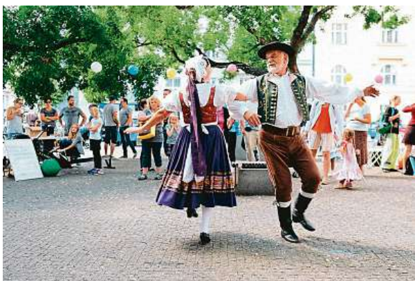
Program je plně v režii spolků či dobrovolníků. Ti přinášejí do veřejného prostoru kulturu i gastronomii. ZAŽÍT MĚSTO JINAK

„Zažít město jinak je akce, která pomohla zapsat náš spolek do povědomí široké veřejnosti. Vzbuzuje u ní zájem o komunitní dění i své