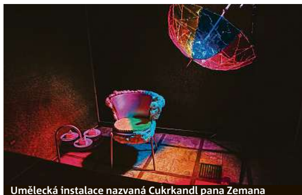
Umělecká instalace nazvaná Cukrkandl pana Zemana

mohli zrenovovat a vystavit jako exponáty. Například původní pec,“ říká Zeman.