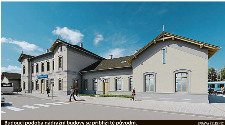
Budoucí podoba nádražní budovy se přiblíží té původní.

Budovu čeká sanace vlhkého zdíva, výměna oken a dveří, zateplení a obnovení původního vzhledu fasády včetně