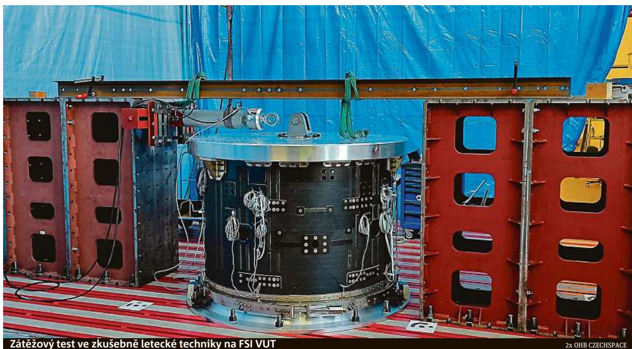
Zátěžový test ve zkušebně letecké techniky na FSI VUT

dodal Rohel. Mise Plato má pomocí odpovědět na otázku, zda existují planety podobné Zemi. Ve vesmíru bude hledat planety obíhající kolem jasných hvězd jiných než Slunce, takzvané exoplanety. Sonda se má vydat na oběžnou dráhu v roce 2026. RADEK BABIČKA