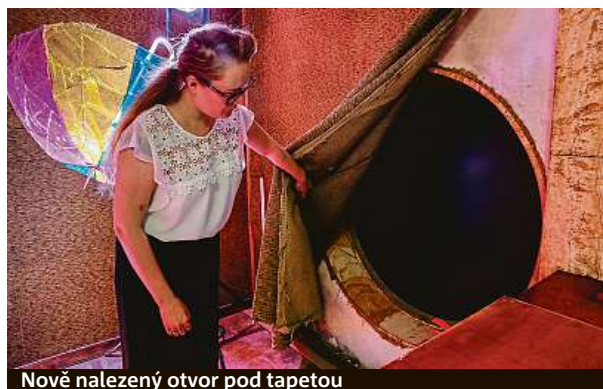
Nově nalezený otvor pod tapetou