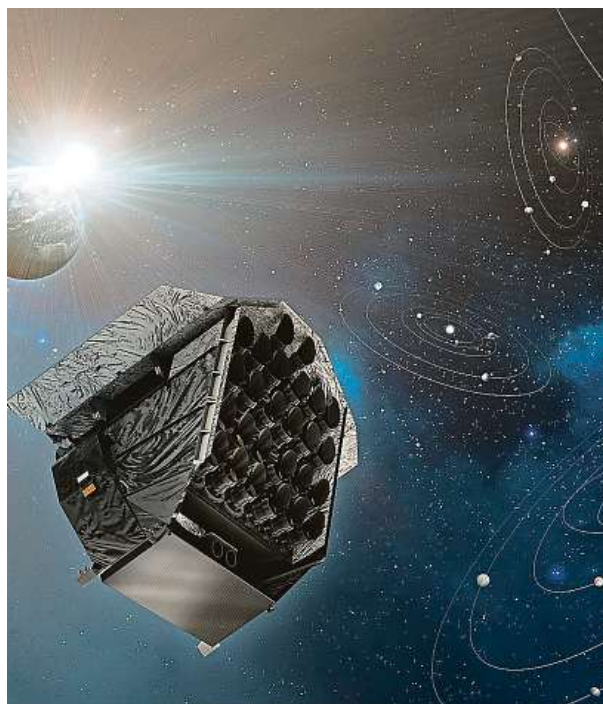
Vizualizace mise Plato