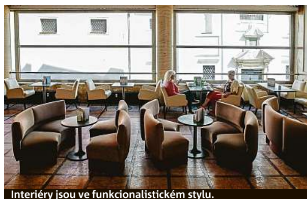
Interiéry jsou ve funkcionalistickém stylu.

„Máme tu několik zajímavých kousků, které bychom