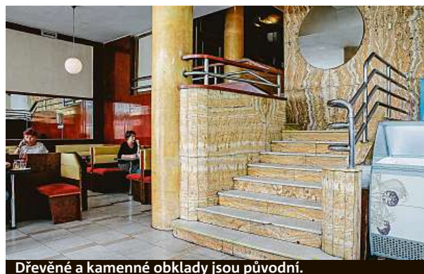
Dřevěné a kamenné obklady jsou původní.