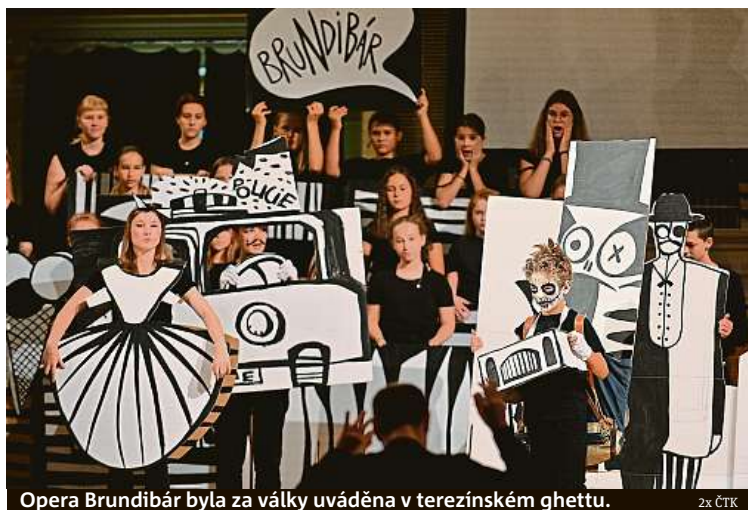
Opera Brundibár byla za války uváděna v terezínském ghettu.