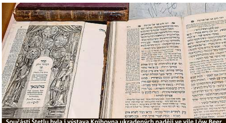
Součástí Štetlu byla i výstava Knihovna ukradených nadějí ve vile Löw Beer

První ročník festivalu Štetl nabídl desítky akcí na různých místech v Brně, od komorních besed po velké koncerty. Ambici pořadatelů ze Židovské obce Brno a spolku Štetl je proměnit stejnojmennou přehlídku v největší festival židovské kultury v Česku.